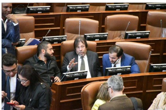
El representante César Lorduy (c) dialoga con el senador Arturo Char tras una de las sesiones en el Congreso.