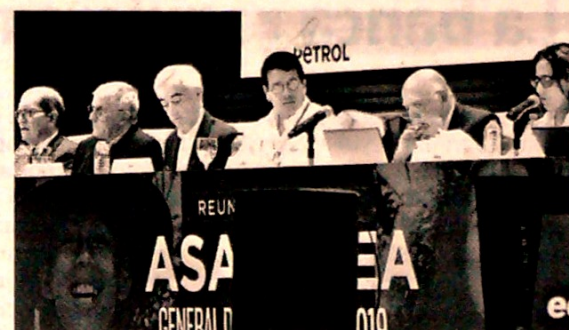
Asamblea aprobó distribución de $225 por acción.