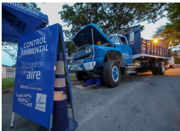
BLU Radio. Controles de emisión de gases en Medellín / Foto: Secretaría de Movilidad