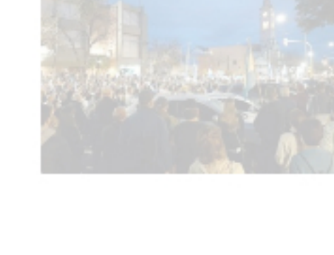
Entreteles de la decisión ¿Te enteraste?