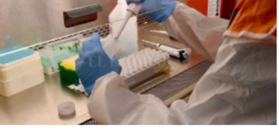
Se realizará una segunda prueba para confirmar el resultado negativo