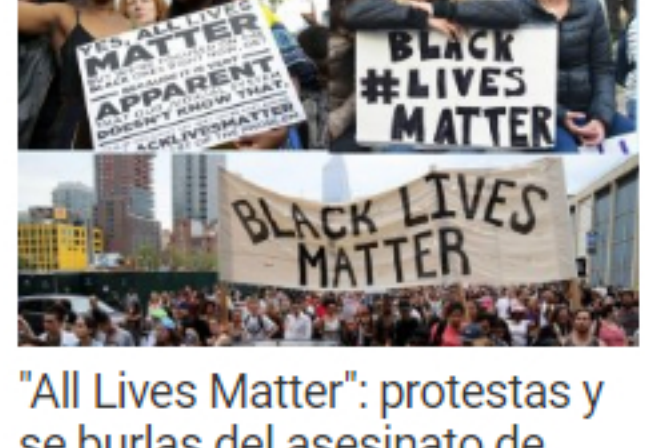
'All Lives Matter': protestas y se burlas del asesinato de Floyd