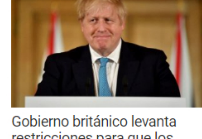
Gobierno británico levanta restricciones para que los solteros puedan encontrarse en privado