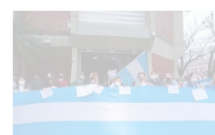
Regionales Tensa calma en Avellaneda