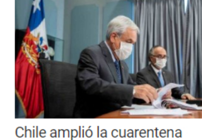
Chile amplió la cuarentena total a varias regiones tras el alarmante aumento de contagios