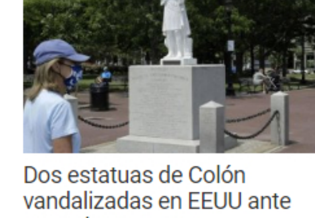
Dos estatuas de Colón vandalizadas en EEUU ante auge de protestas antirracistas