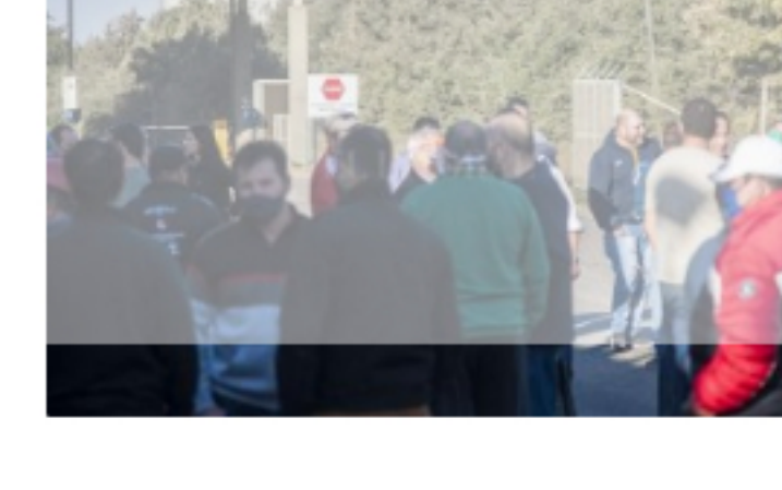
Economía Vicentin, en contacto con los interventores