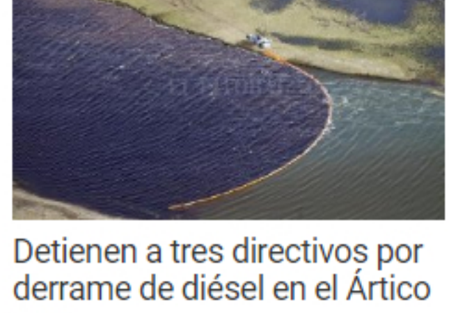
Dienten a tres directivos por derrame de diésel en el Ártico ruso