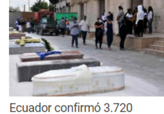
Ecuador confirmó 3.720 muertos y 44.440 casos positivos por Covid-19