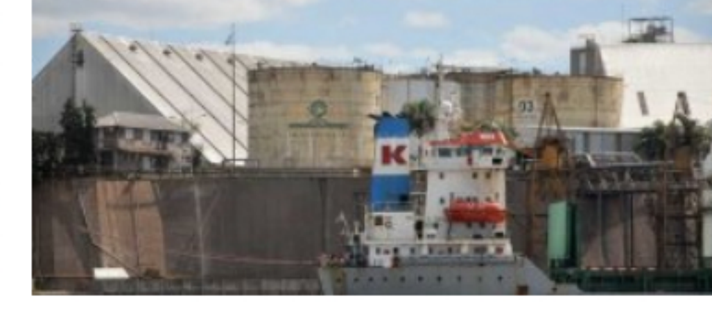
El gobierno anunció la intervención de la empresa y planea expropiarla

El ministro Parola admitió el error: no hay caso positivo de Covid en la ciudad