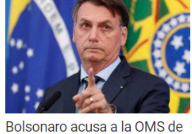
Bolsonaro acusa a la OMS de querer quebrar a Brasil con sus recomendaciones