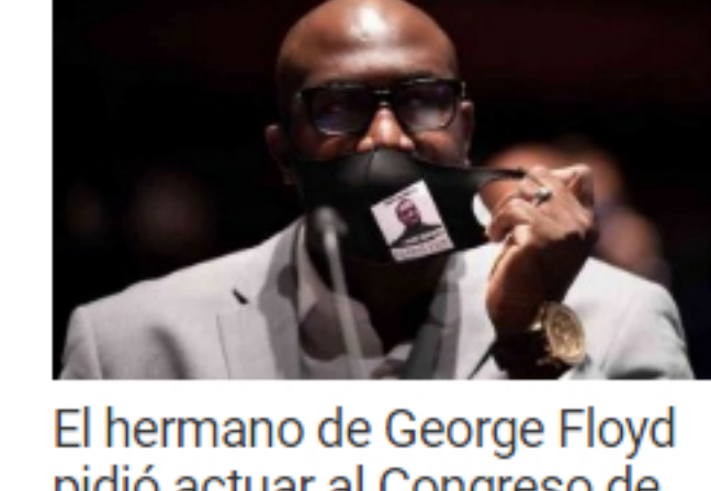
El hermano de George Floyd pidió actuar al Congreso de Estados Unidos