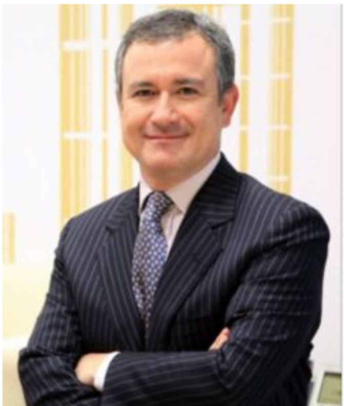
Rafael Guzmán, presidente de Hocol.

La empresa Hocol comenzó la operación de los campos de gas Chuchupa A y B y Ballena a las 00:00 horas de este 1 de mayo del 2020, utilizando todas las instalaciones y la mayoría del personal que es colombiano y en donde hay muchos guajiros.