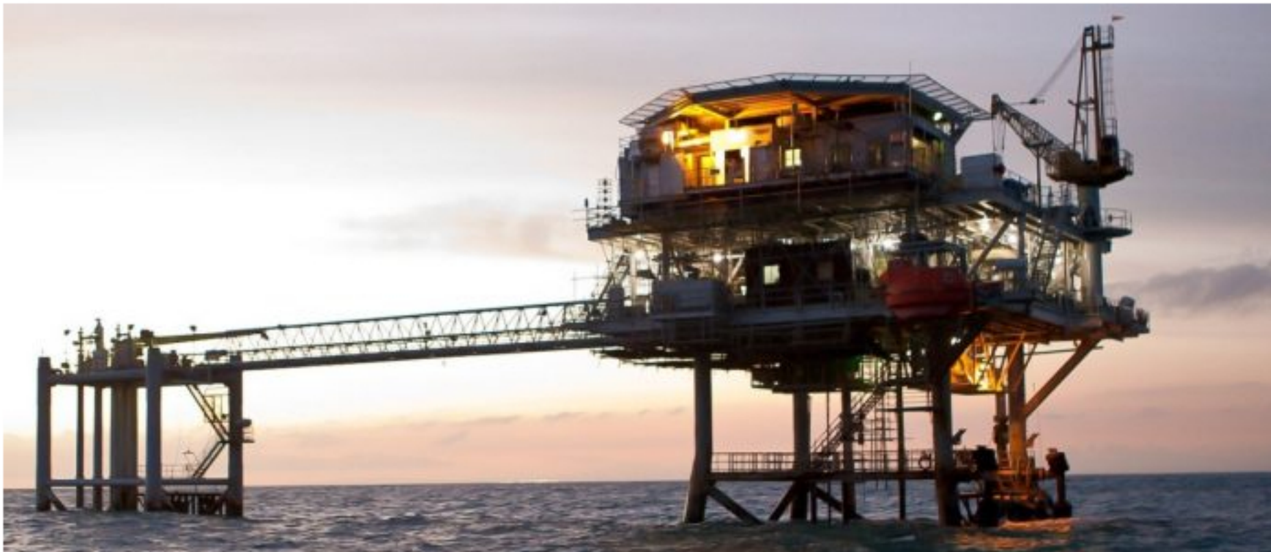
Esta es la plataforma Chuchupa localizada en alta mar frente a las costas del municipio de Manaure.