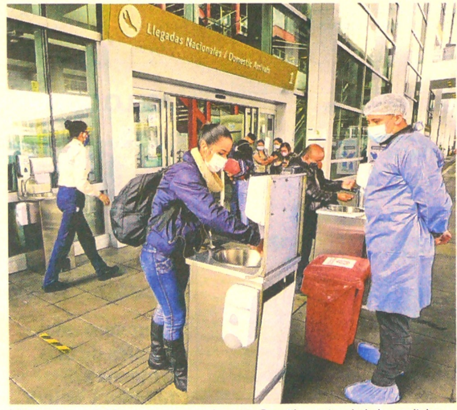
Inicialmente se abrirían unos pocos vuelos entre Bogotá y cuatro ciudades capitales.

ARRIENDO COMERCIAL: EL 41% NO HA PAGADO En cinco de cada 10 casos aún no se logran acuerdos entre los propietarios y los inquilinos. Pág. 7