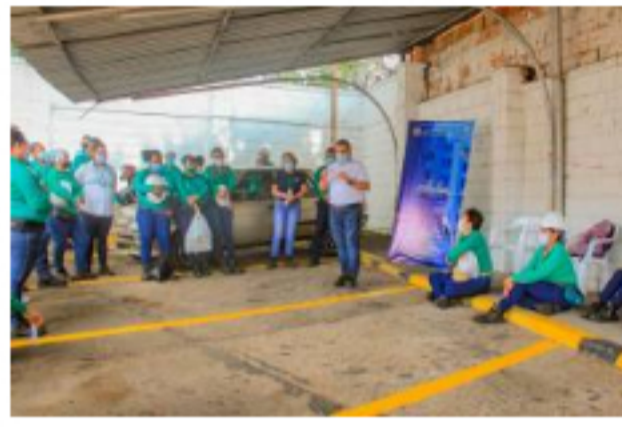
Eduba llega desde esta semana a las empresas

Esta clase de delitos se ha venido incrementando en el último año. Mientras que en el 2019 se registraron 49 hurtos en los campos de producción de la región, en el 2020 la cifra ascendió a 113 casos, es decir un aumento del 130%. En lo corrido del 2021 ya se han registrado 37 eventos", precisó Ecopetrol mediante comunicado de prensa.