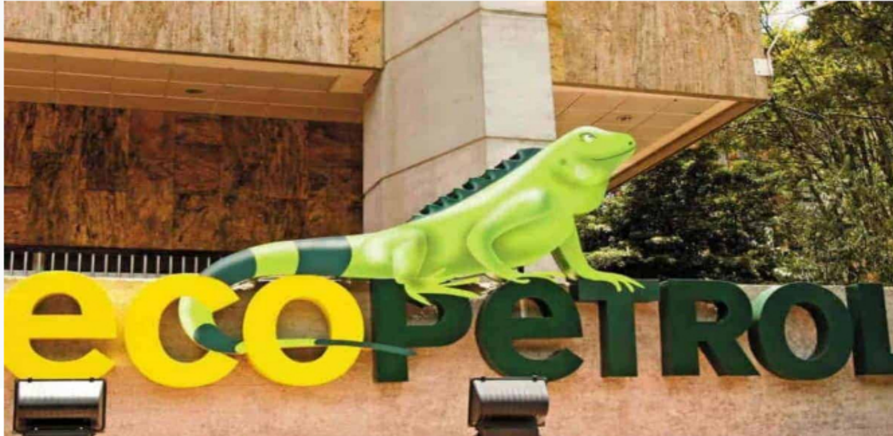
Ecopetrol firmó contrato con el que adquiere 51,4% de participación accionaria de ISA

Ecopetrol suscribió un contrato interadministrativo con el Ministerio de Hacienda, mediante el cual adquiere el 51,4% de la participación accionaria de ISA.