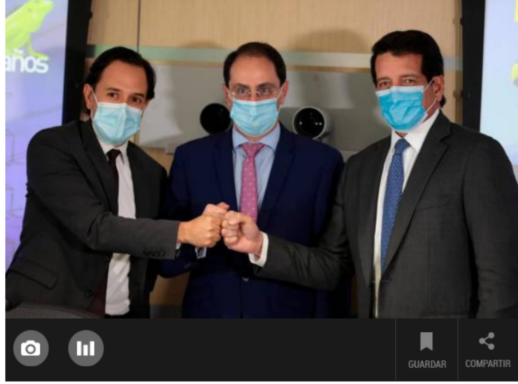
Los ministros de Minas y Energía, Diego Mesa, y de Hacienda, José Manuel Restrepo, junto a presidente de Ecopetrol, Felipe Bayón, durante el anuncio, en la noche de este miércoles, de la compra de ISA por $14,23 millones.

ECONOMÍA EMPRESAS ECOPETROL ENERGÍA ISA CONTENIDO EXCLUSIVO SUSCRIPTORES