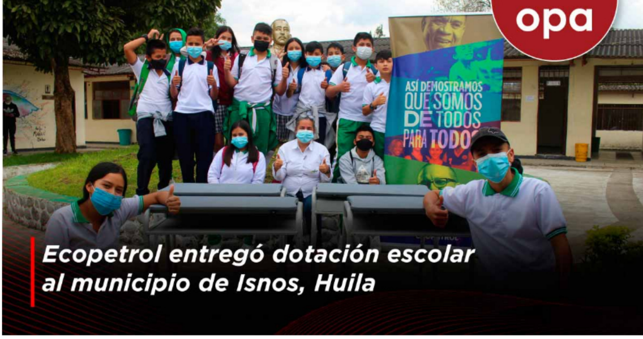
Ecopetrol entregó dotación escolar al municipio de Isnos, Huila

Con el propósito de contribuir al cierre de brechas en la educación y reducir la deserción escolar, Ecopetrol entregó elementos de mobiliario para las sedes rurales y urbanas de las 7 instituciones educativas del municipio de Isnos, departamento del Huila.