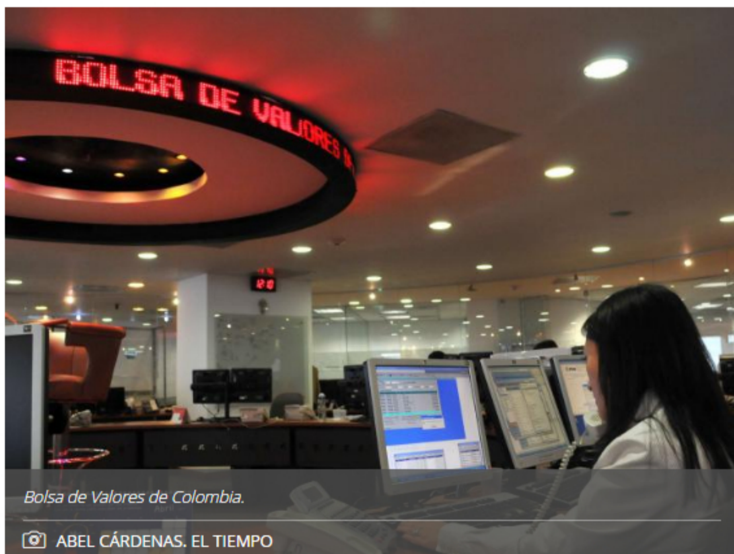
Bolsa de Valores de Colombia.