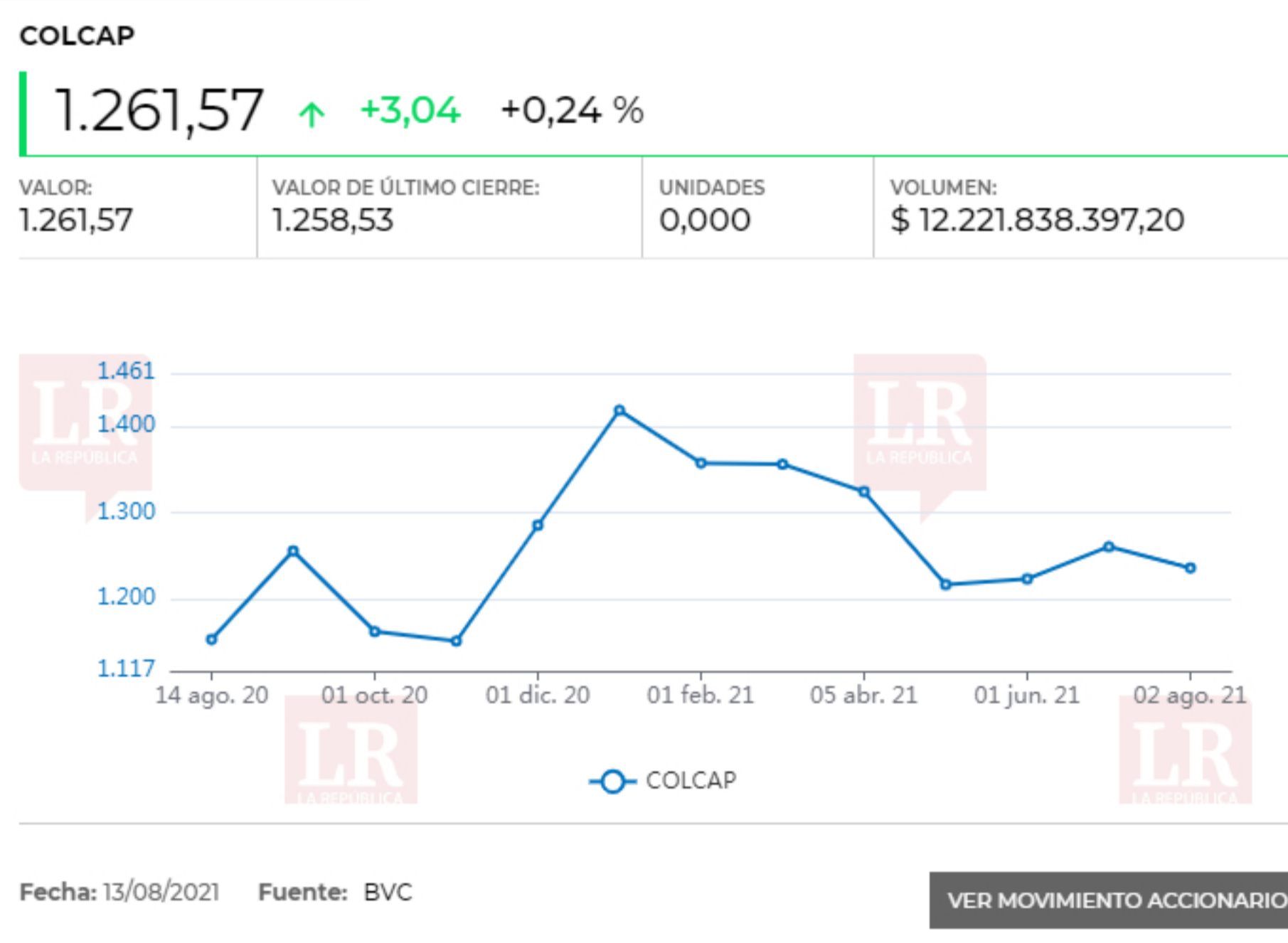
Fecha: 13/08/2021 VER MOVIMIENTO ACCIONARIO