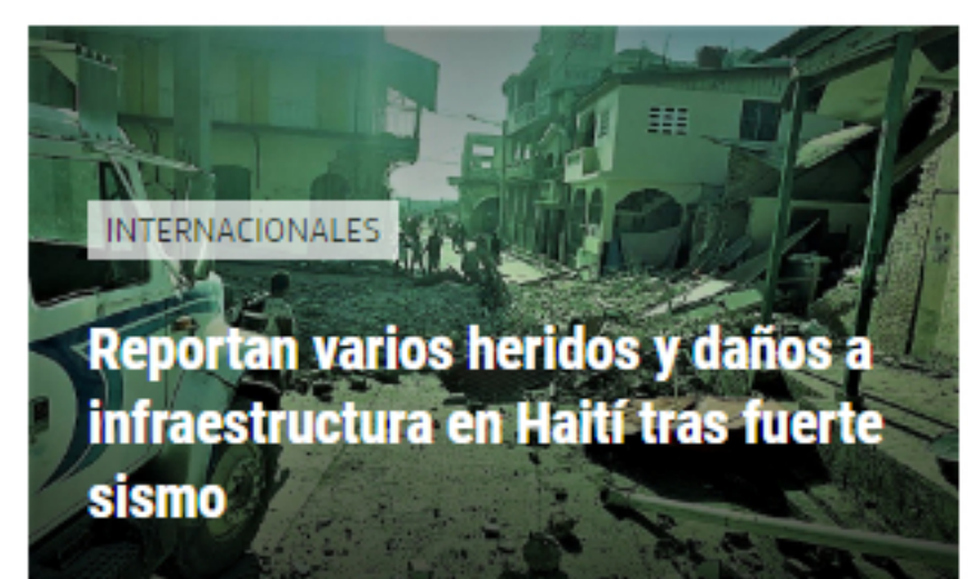
INTERNACIONALES Reportan varios heridos y daños a infraestructura en Haití tras fuerte sismo