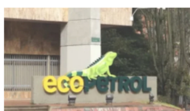
La empresa canadiense Parex Resources asumirá operación de dos bloques de Ecopetrol en Arauca julio 8, 2021 En «ECONOMÍA»