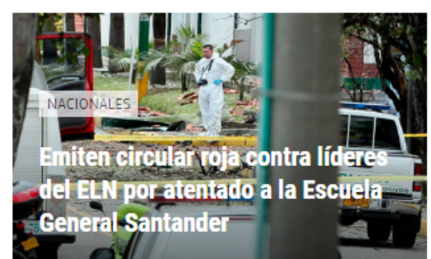
NACIONALES Emiten circular roja contra líderes del ELN por atentado a la Escuela General Santander