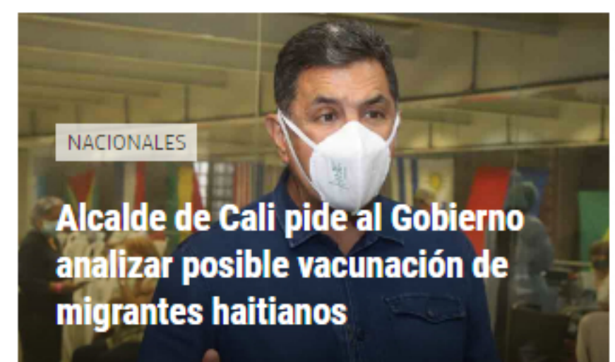
NACIONALES Alcalde de Cali pide al Gobierno analizar posible vacunación de migrantes haitianos