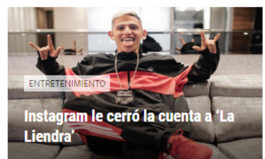
ENTRETENIMIENTO Instagram le cerró la cuenta a 'La Liendra'