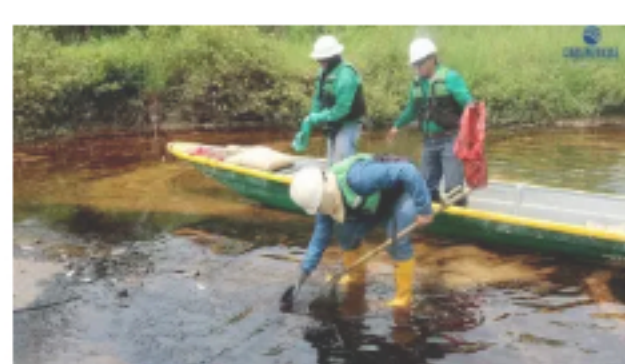
Ecopetrol aceptó responsabilidad por derrame de crudo en Barrancabermeja agosto 2, 2021 En «NACIONALES»