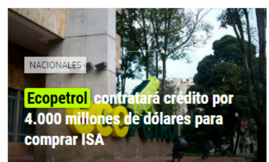
NACIONALES Ecopetrol contratará crédito por 4.000 millones de dólares para comprar ISA