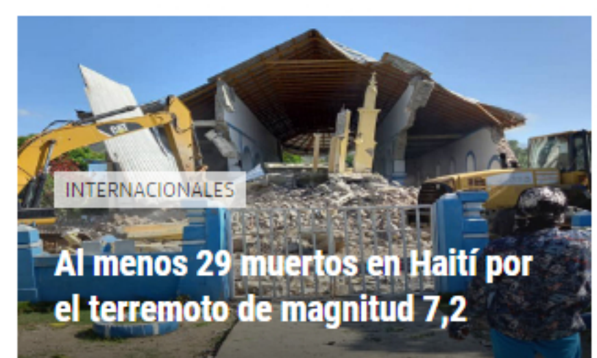
INTERNACIONALES Al menos 29 muertos en Haití por el terremoto de magnitud 7,2