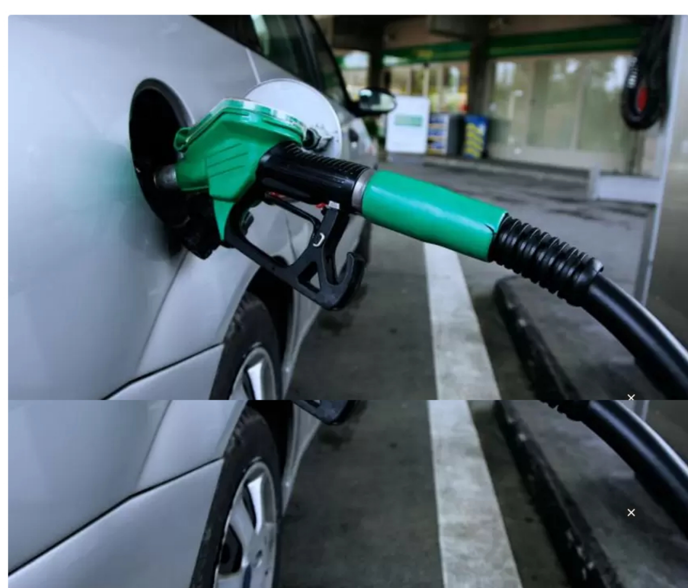
Suministrada Imzacom - Fendi petróleo

B arranquilla fue una de las ciudades de la Costa Caribe más afectadas por la crisis de desabastecimiento de combustible, ante la salida de operación de las unidades de procesos en la Refinería de Cartagena ( Reficar ).