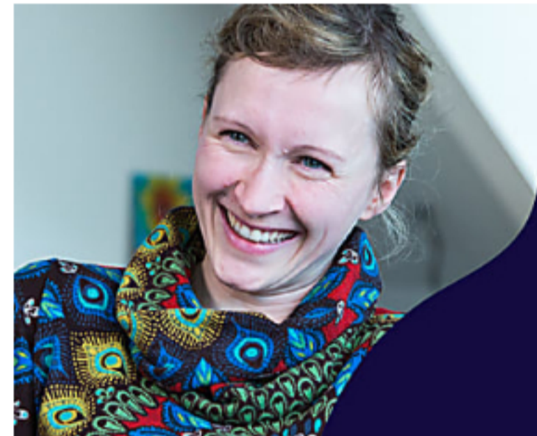
Experta en lingüística explica cómo hablar inglés con solo 15 min de estudio al día