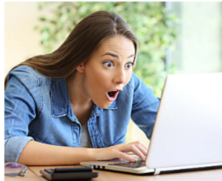
Únete al curso de inglés #1 en Bogotá.