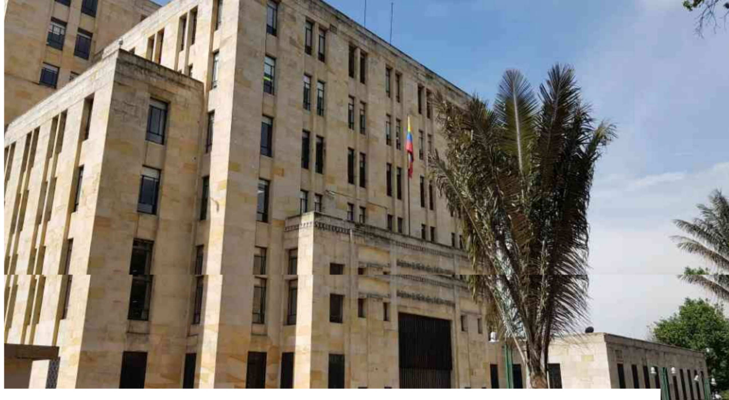
Gobierno emitirá deuda para pagar bonos pensionales en 2021.

El Ministerio de Hacienda publicó un proyecto de decreto por medio del cual autoriza la emisión de títulos de tesorería (TES) clase B para llevar a cabo el pago de los bonos pensionales a cargo de la Nación en 2021.