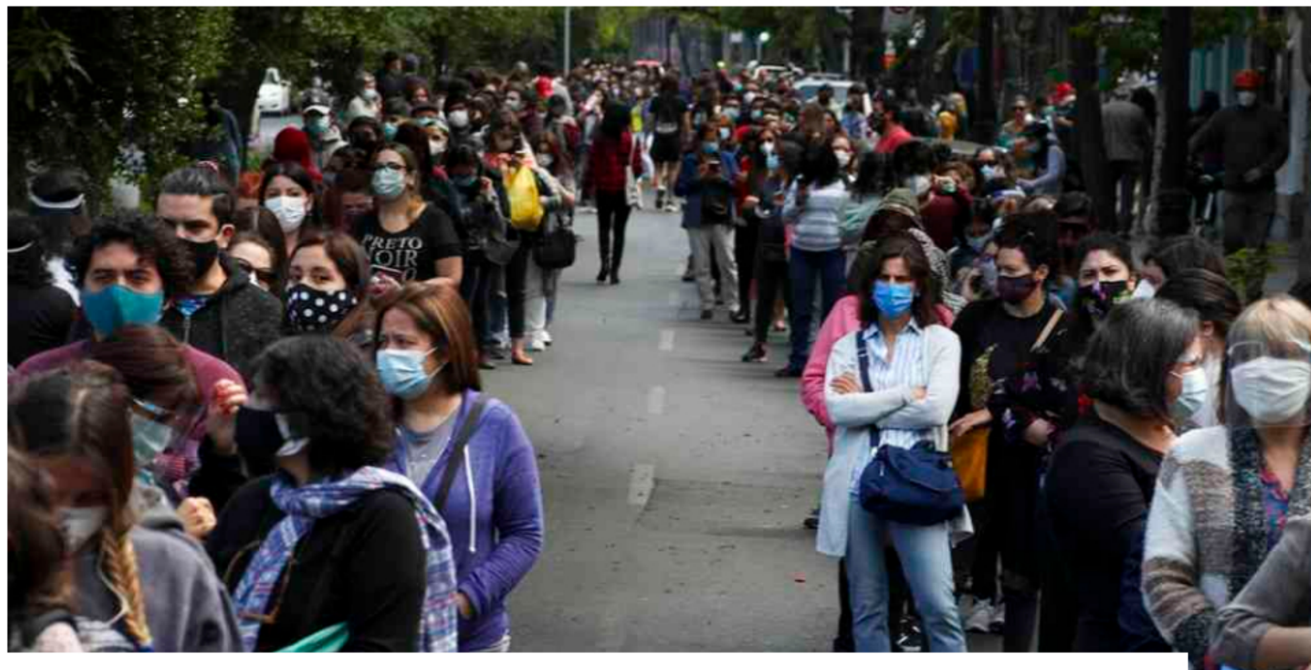
En Chile aprueban un segundo retiro anticipado de los fondos de pensiones

La Cámara de Diputados y el Senado de Chile han aprobado un proyecto de ley para un segundo retiro anticipado del 10% de los fondos privados de pensiones para hacer frente a la crisis provocada por la pandemia de la covid-19, tras una jornada maratónica en ambas cámaras. Se espera que las primeras solicitudes lleguen el 7 de diciembre, cuando previsiblemente se publicará la medida en el Diario Oficial y se convertirá en ley, aunque según resalta la prensa chilena, a lo largo de este viernes y durante el fin de semana las Administradoras de Fondos de Pensiones (AFP) deberían empezar a informar a sus afiliados de la cantidad que pueden retirar. EP.