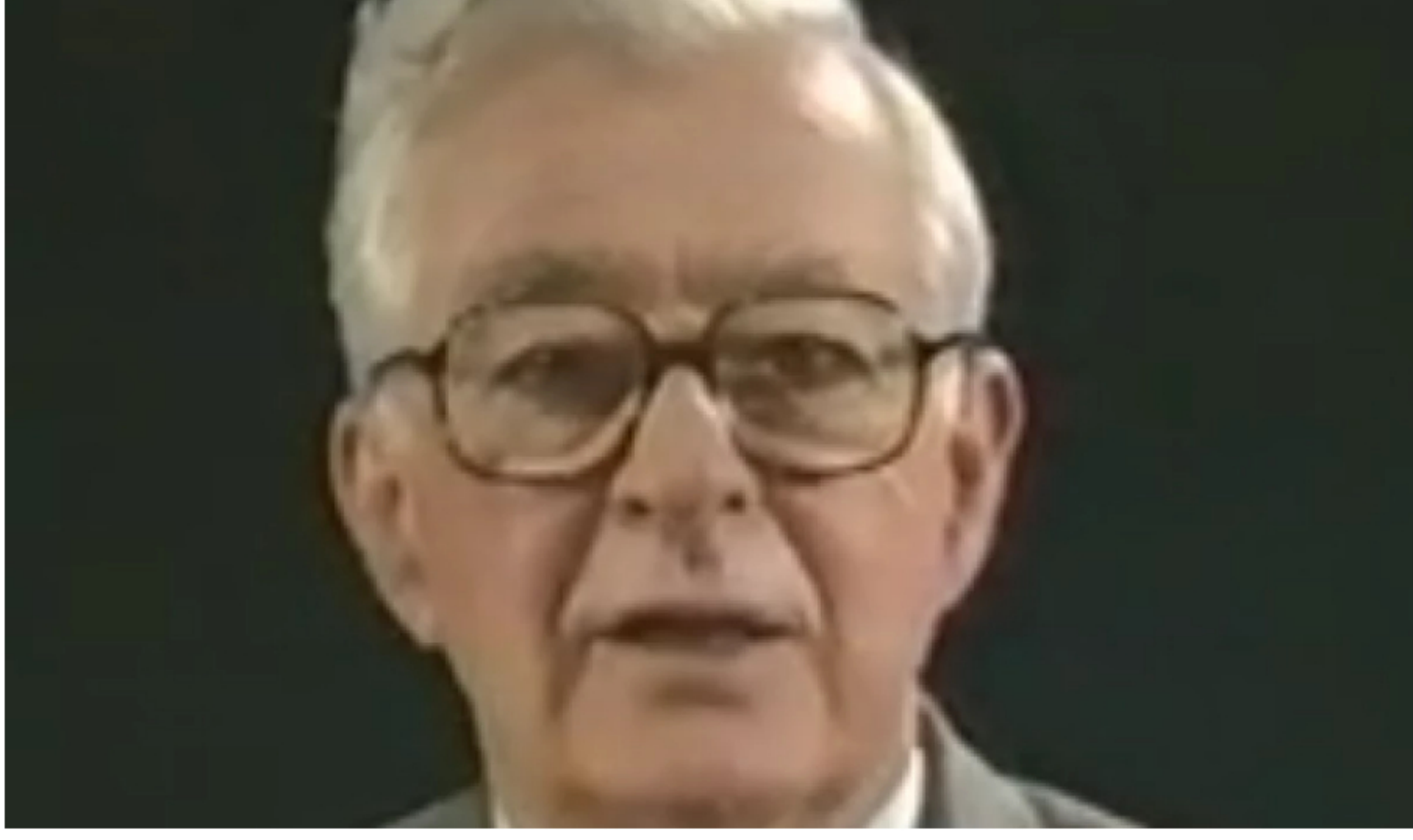
Virgilio Barco.