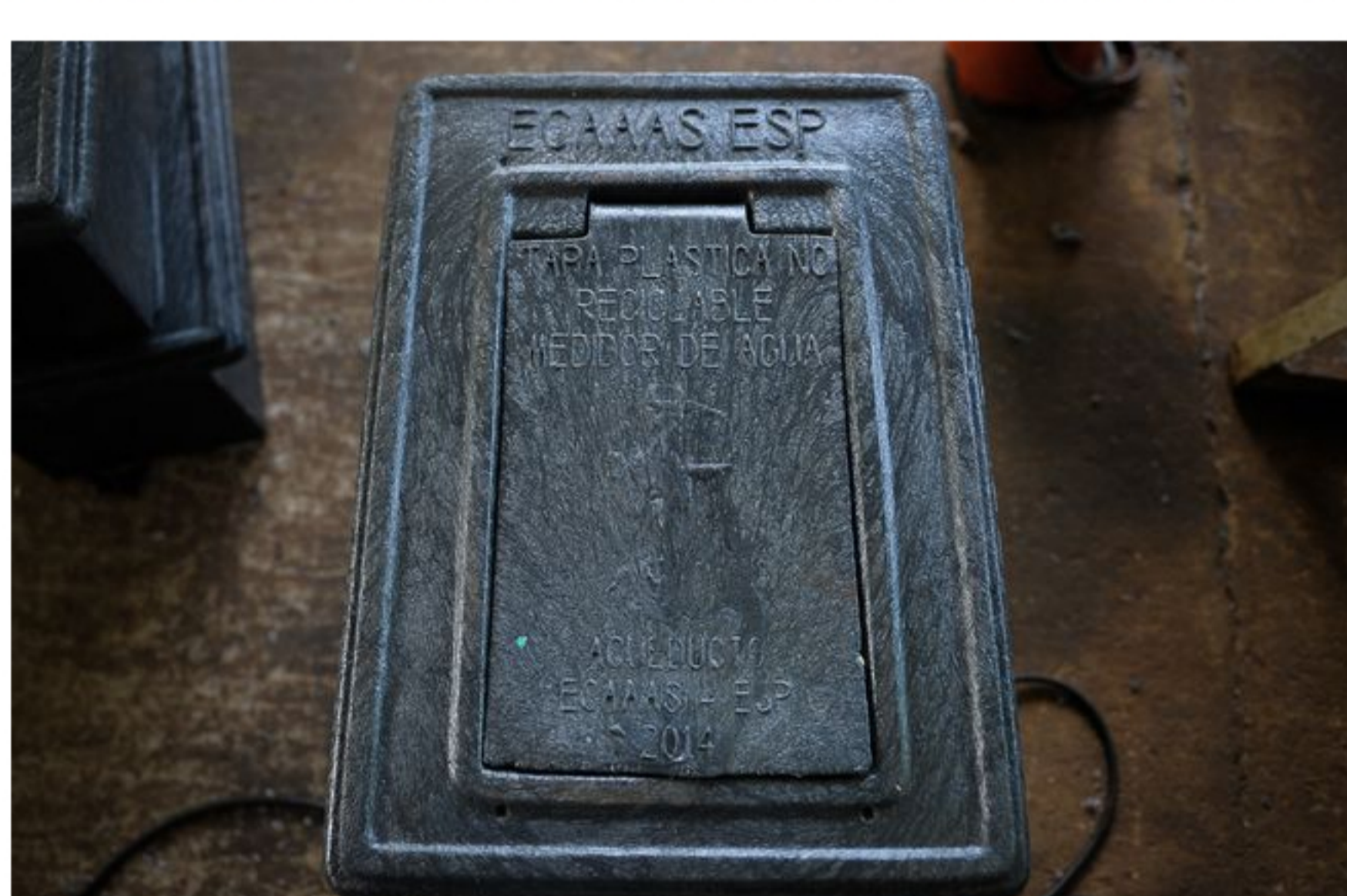
Los contenedores con los medidores de agua se instalan en cada una de las casas de los beneficiarios.

La movilización social y la lucha comunitaria en Arauca es histórica, y es por este medio que los pobladores han conseguido hacer valer muchos de sus derechos y demandas. Los servicios públicos no han sido la excepción.