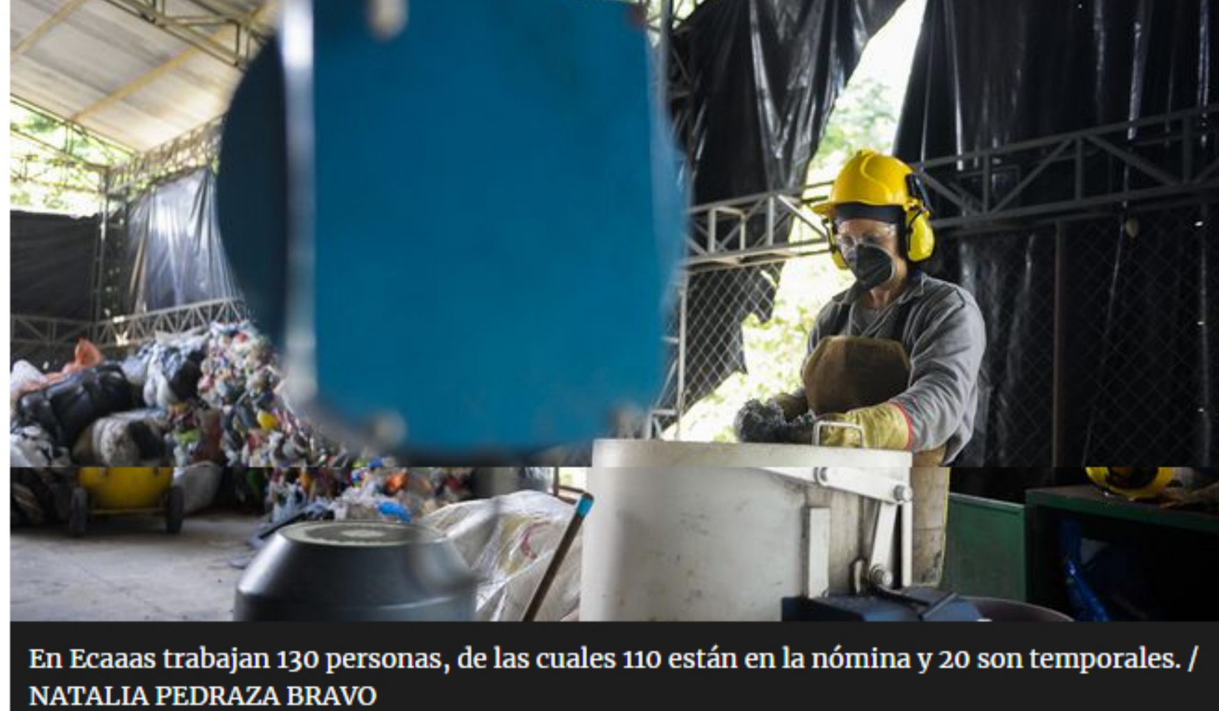
En Ecaas trabajan 130 personas, de las cuales 110 están en la nómina y 20 son temporales.