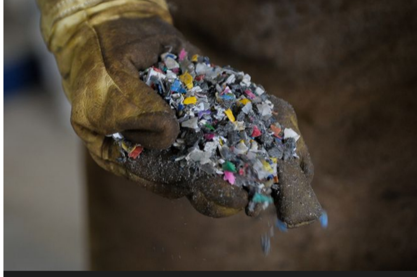
Al mes procesan entre 5 y 10 toneladas de plástico.

Cali tendrá toque de queda y ley seca extendida durante este fin de semana