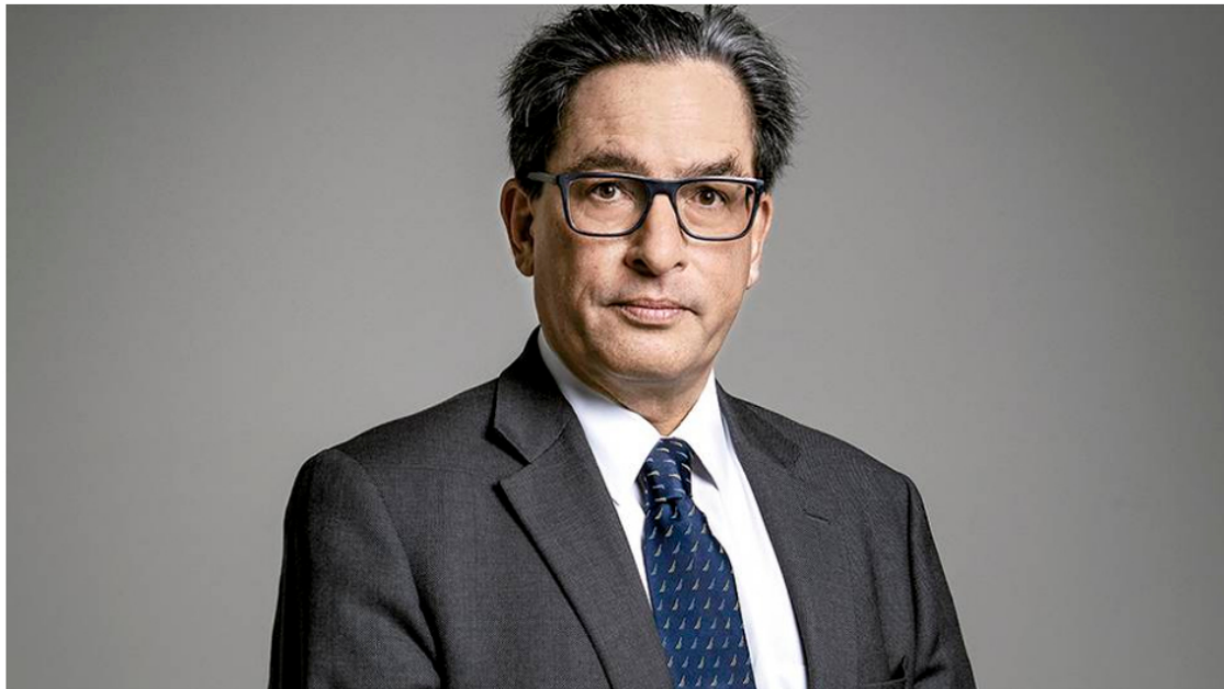
ALBERTO CARRASQUILLAMinistro de Hacienda

Una de las tareas más complejas del Gobierno este año es cuadrar sus finanzas y mandar mensajes tranquilizadores a las calificadoras para no perder el grado de inversión. El endeudamiento se acerca a 65 por ciento del PIB y la caída del recaudo en 2020 superó 20 billones de pesos.