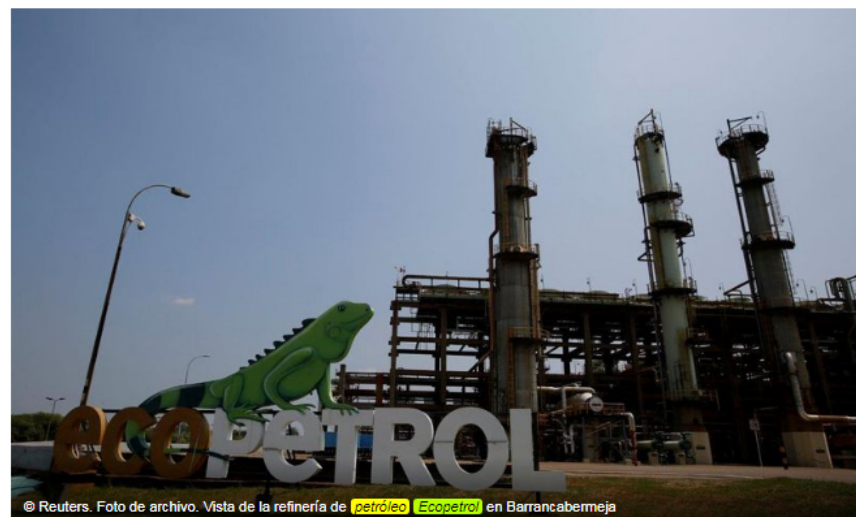
Foto de archivo. Vista de la refinería de petróleo Ecopetrol en Barrancabermeja