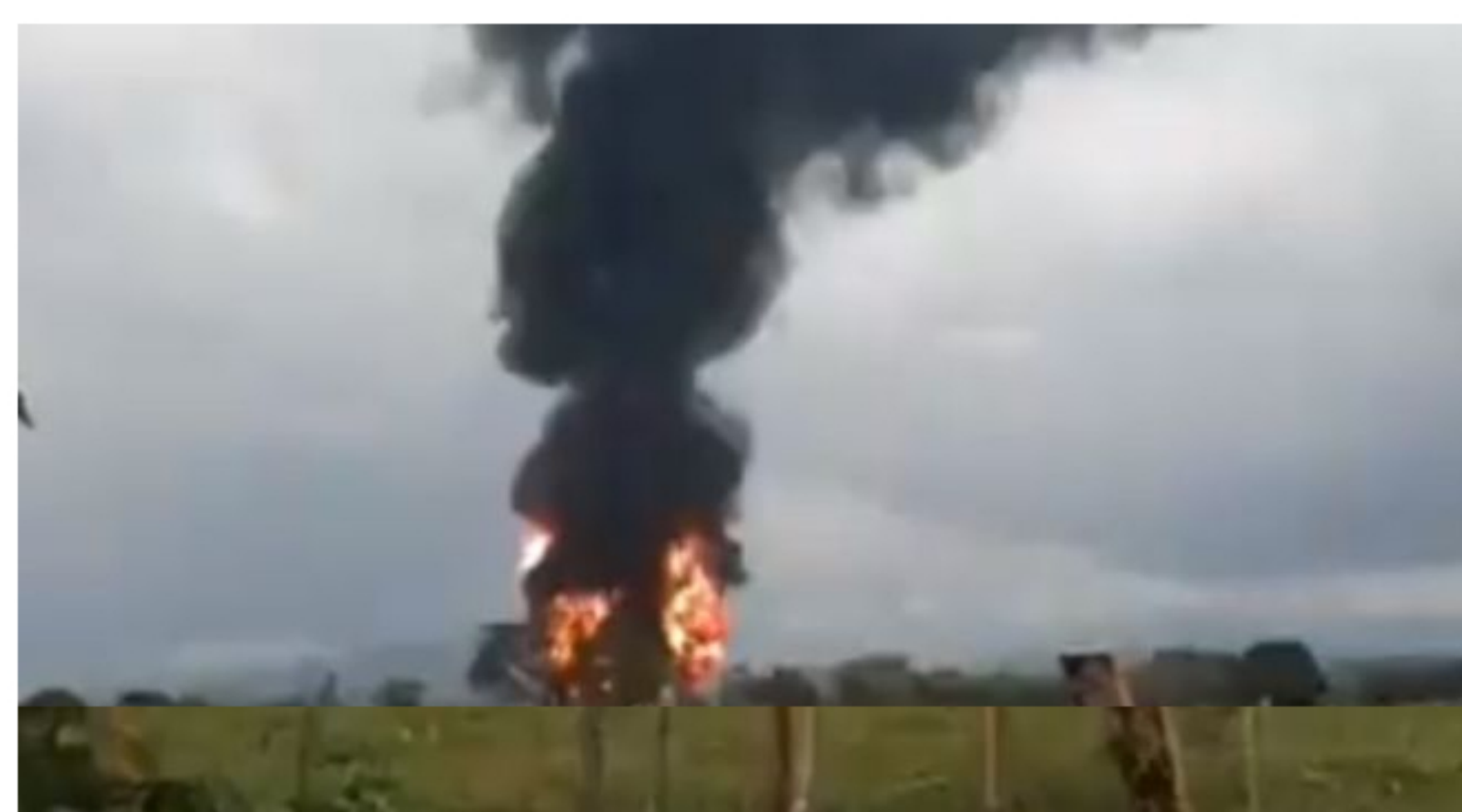
El incidente fue reportado por la comunidad mediante vídeos subidos a las redes sociales.