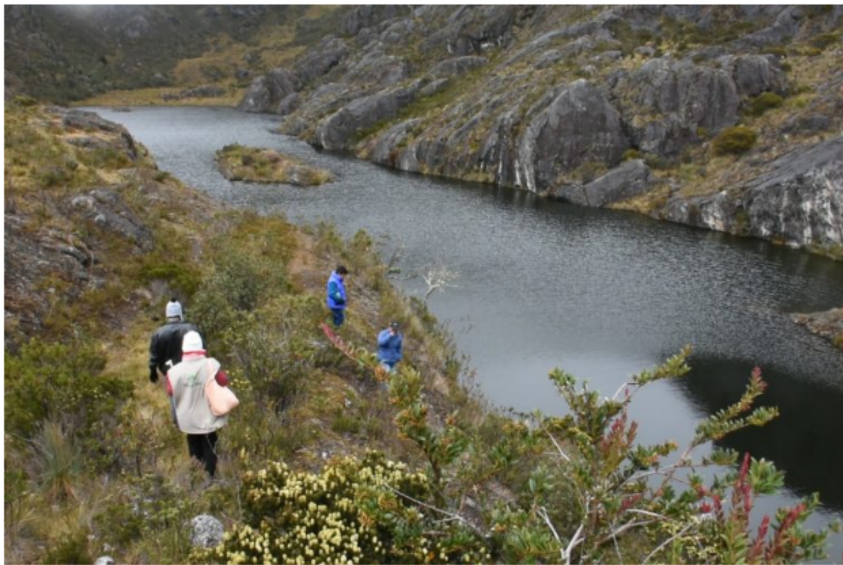
Páramo de Santurbán

GUILLERMO GARCÍA REALPE | OPINIÓN 16 horas ago