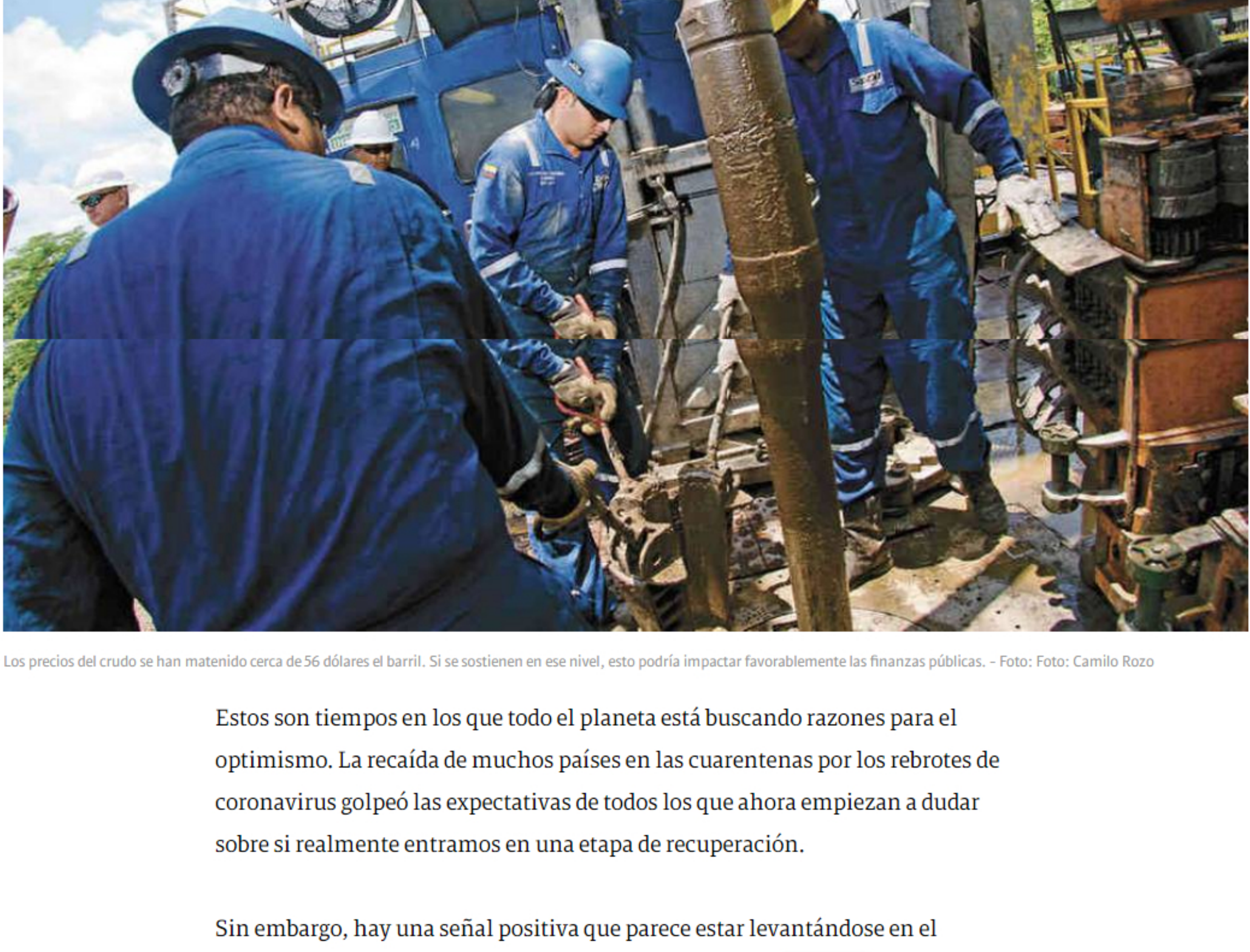
Los precios del crudo se han mantenido cerca de 56 dólares el barril. Si se sostienen en ese nivel, esto podría impactar favorablemente las finanzas públicas.

Estos son tiempos en los que todo el planeta está buscando razones para el optimismo. La recaída de muchos países en las cuarentenas por los rebotes de coronavirus golpeó las expectativas de todos los que ahora empiezan a dudar sobre si realmente entramos en una etapa de recuperación.