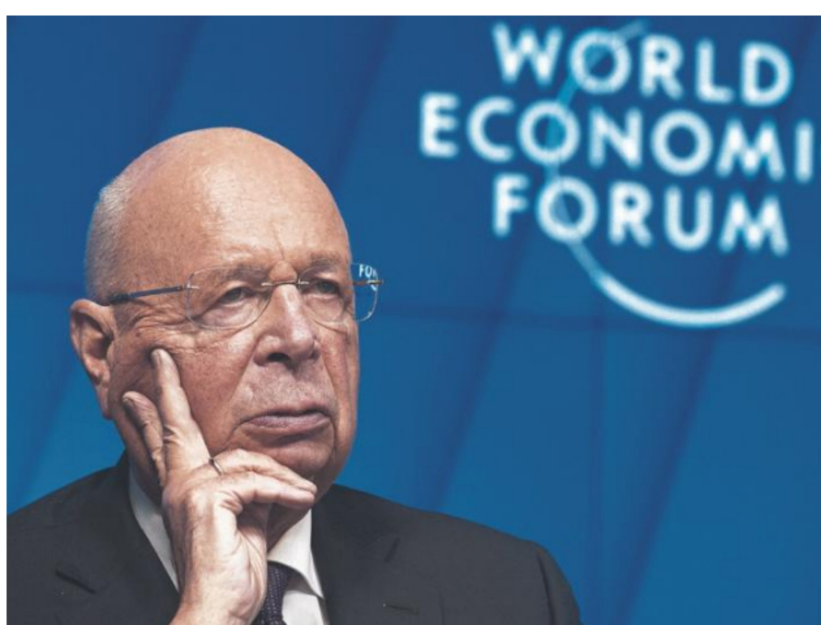
Klaus Schwab, fundador y director ejecutivo del Foro Económico Mundial.