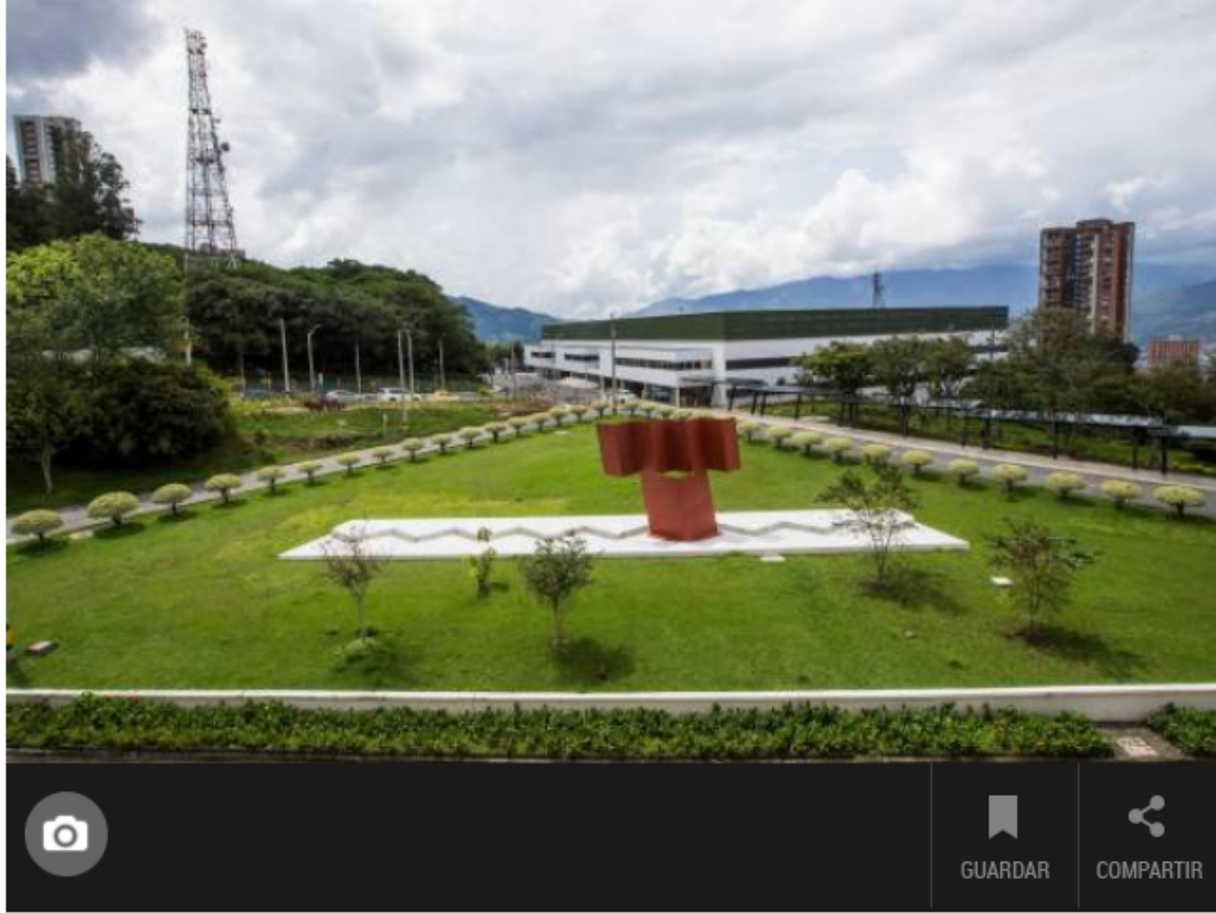
Ecopetrol presentó una oferta para adquirir el 51,41 % de las acciones de ISA.