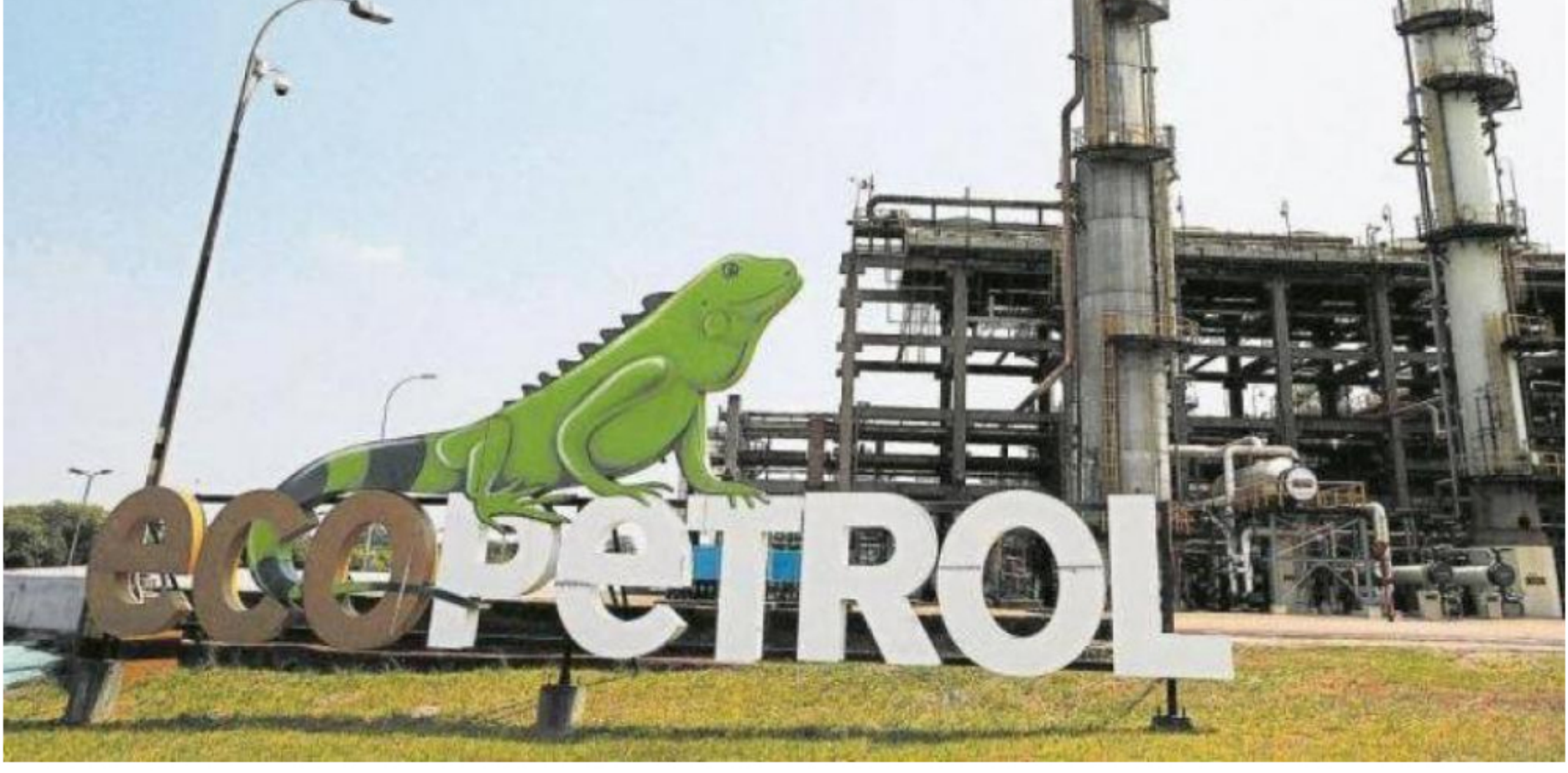
La empresa de petróleo s señaló que esta decisión hace parte del plan para entrar en el mercado energético del país. Foto: _____

RELACIONADOS: EMPRESAS | ISA | ECOPETROL | MINISTERIO DE HACIENDA