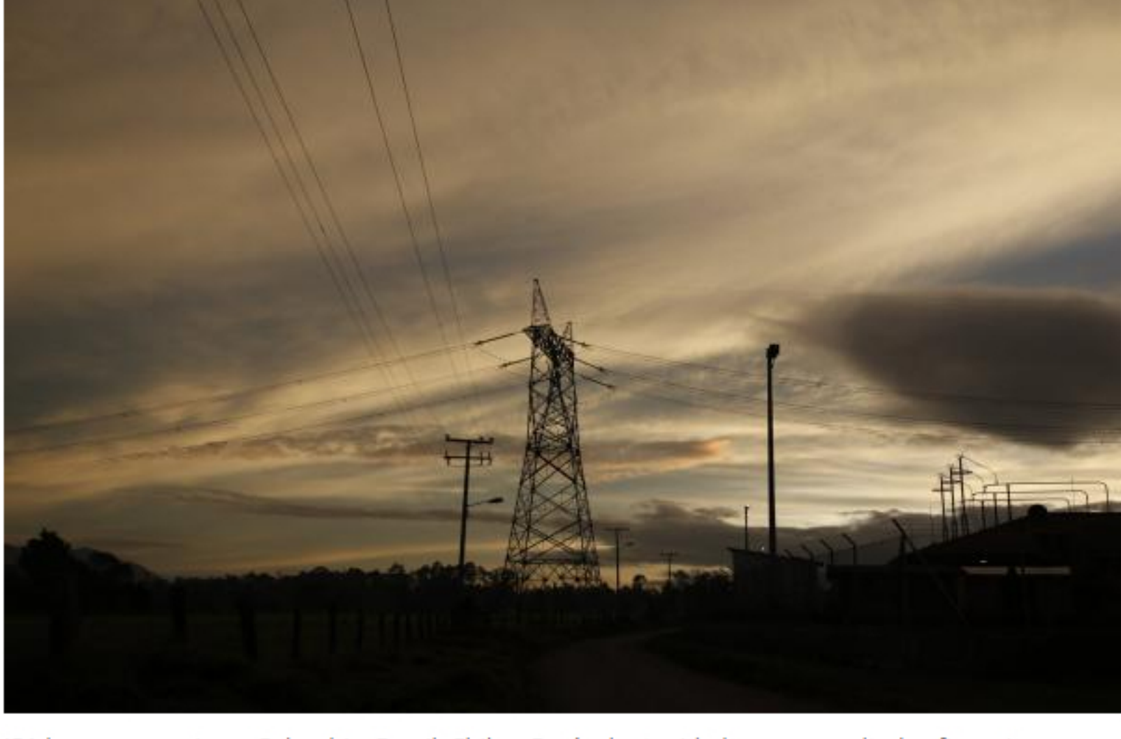
ISA hace presencia en Colombia, Brasil, Chile y Perú y ha tenido buenos resultados financieros en los últimos años.

(Además: El FMI mejora su pronóstico del 2021 para América Latina )