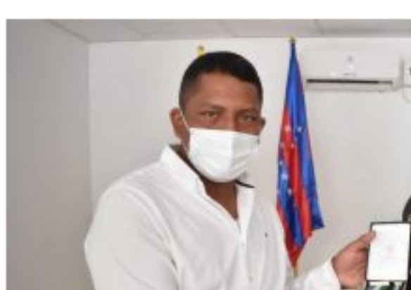
Alcalde de San Zenón no responde por pagos a contratistas