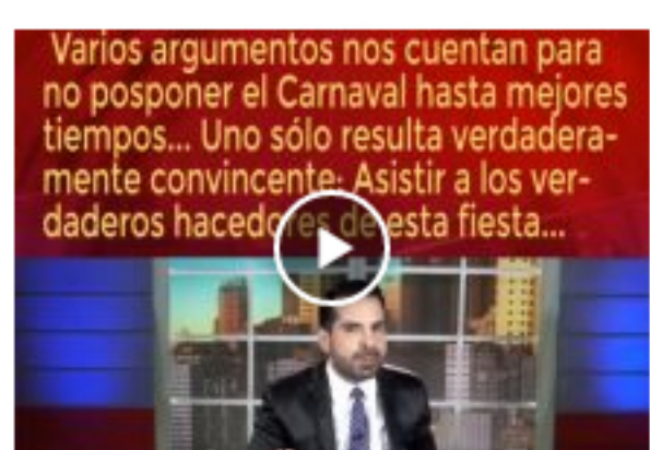
Varios argumentos para no posponer el Carnaval hasta mejores tiempos en Noticias con Libertad