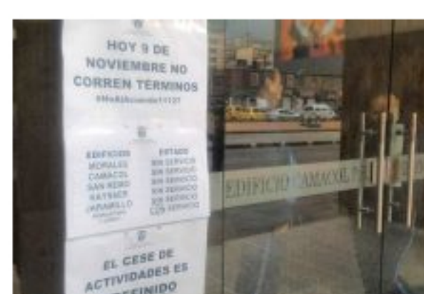
Corte Suprema negó una tutela contra el Plan Nacional de Vacunación