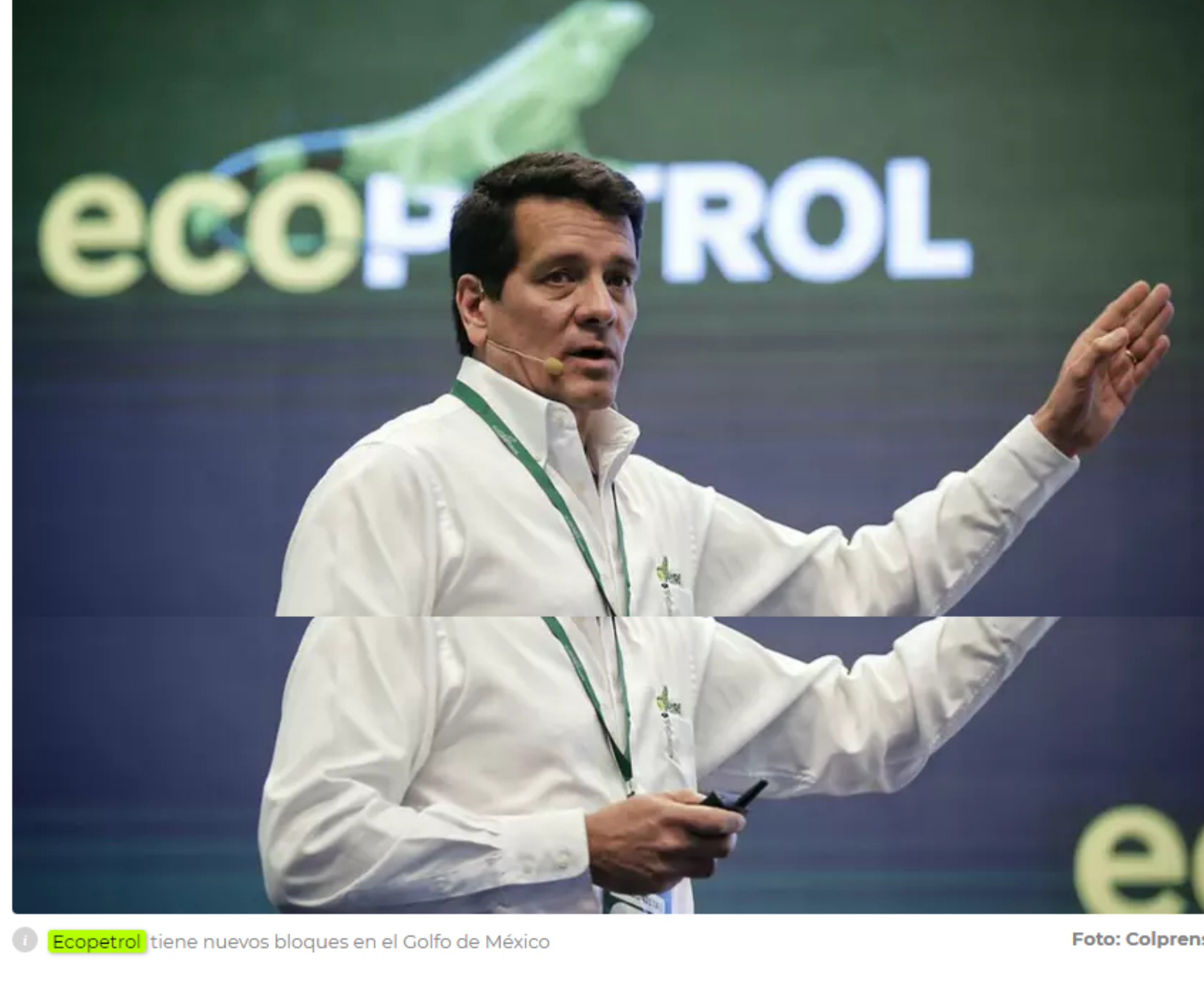
Ecopetrol tiene nuevos bloques en el Golfo de México