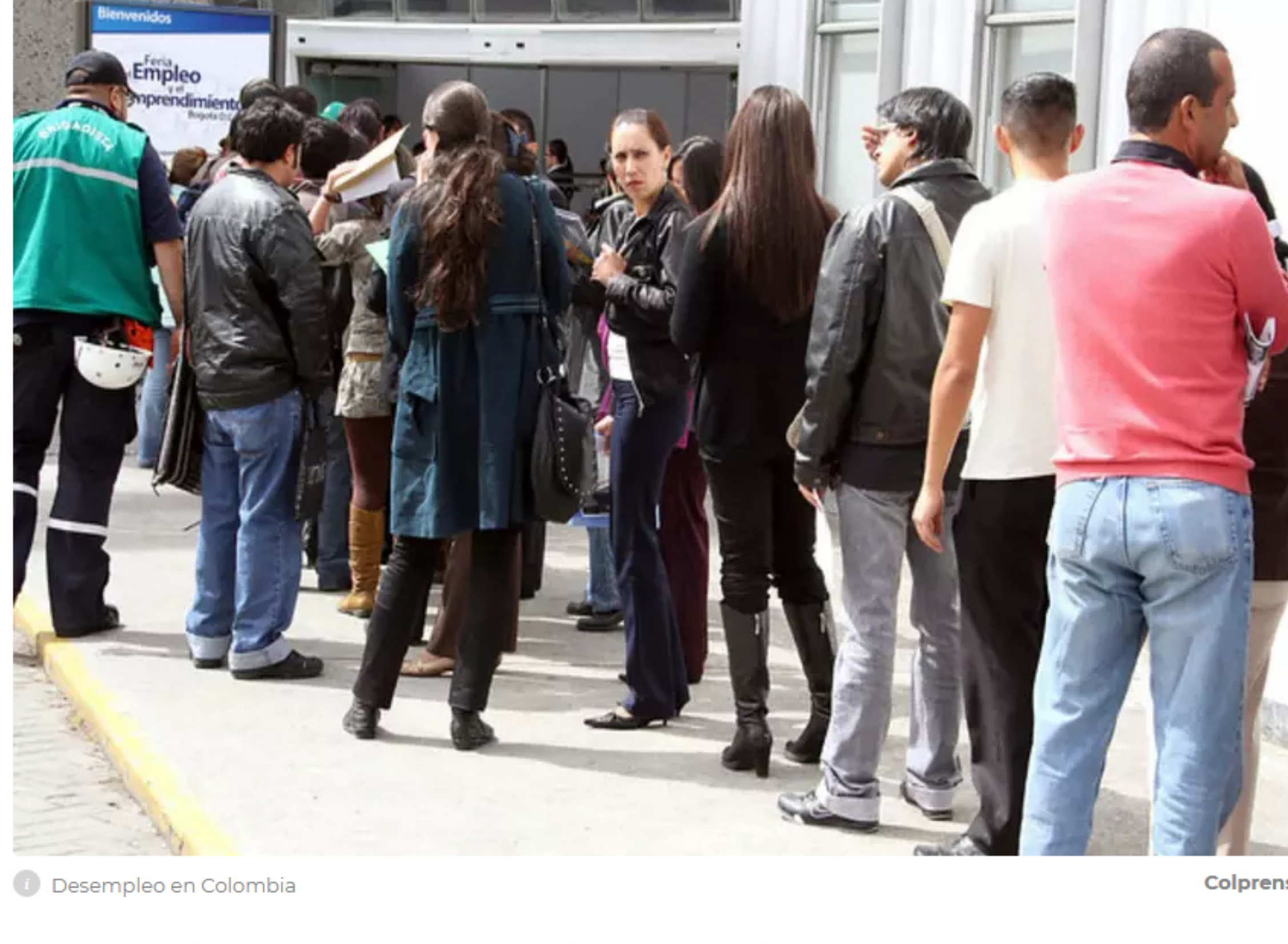
Desempleo en Colombia