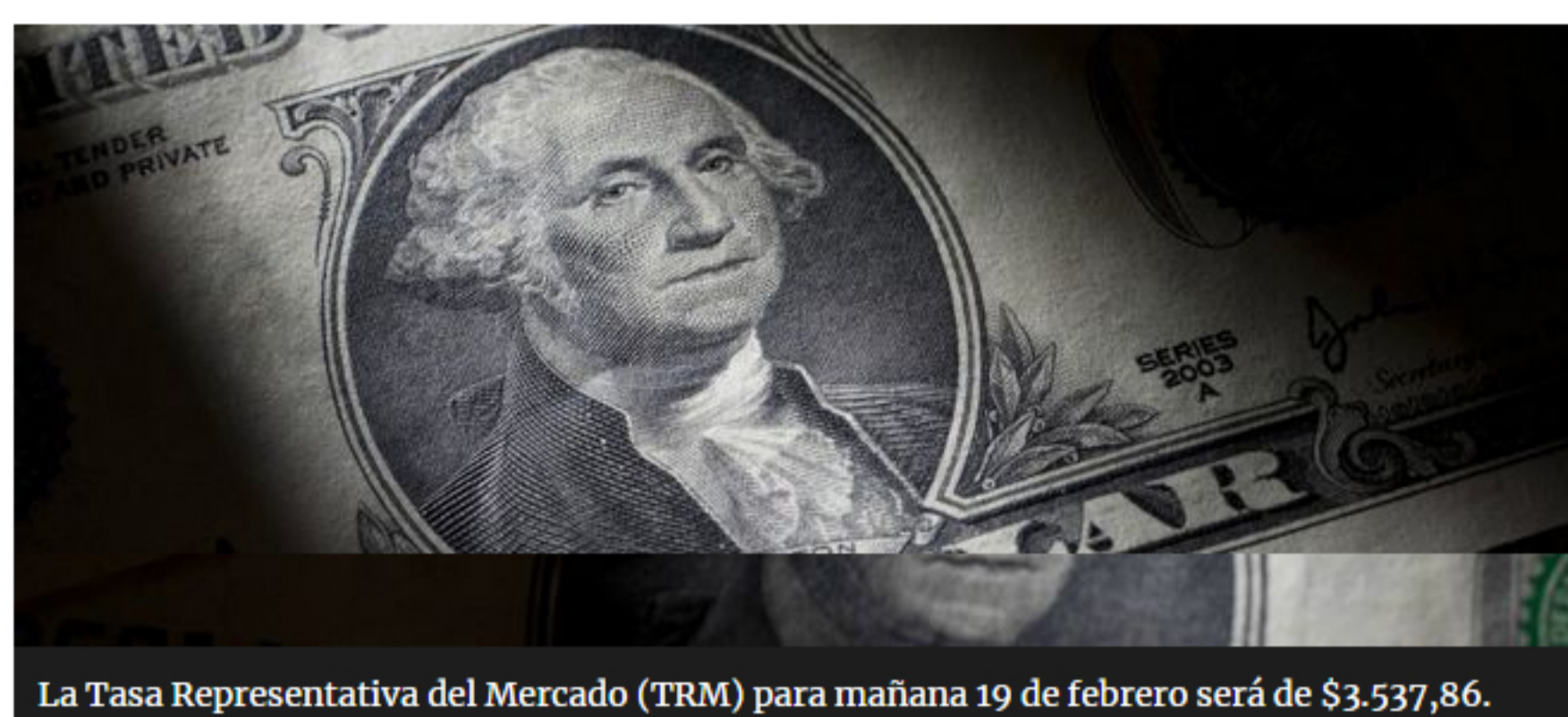
La Tasa Representativa del Mercado (TRM) para mañana 19 de febrero será de $3.537,86.

En la jornada de este jueves, el dólar cerró a $3.547,33 con un alza de 0,78 %. La divisa estadounidense lleva semanas dentro de ese rango, de hecho, el precio promedio hoy se ubicó $3.538,29. La Tasa Representativa del Mercado (TRM) para mañana 19 de febrero será de $3.537,86.