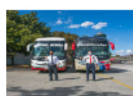
La empresa de mensajería que crearon dos firmas de transporte para sobrevivir a la pandemia