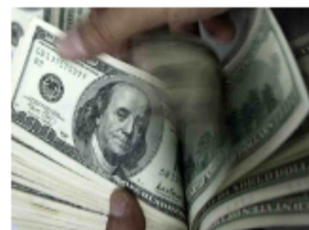
Inicio, variaciones y cierre del precio del dólar en Colombia hoy 17 de febrero