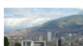
Medellín se convirtió en el centro de conexiones estratégicas de Viva Air