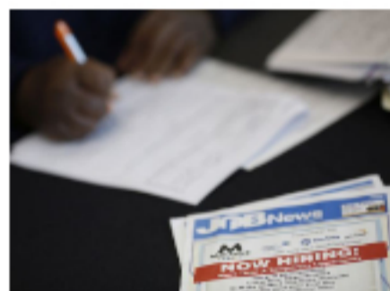
Alza en solicitudes de ayuda por desempleo frena optimismo en EE. UU.

Los precios de los dos barriles de referencia se han apreciado casi un 25 % desde principios de año.