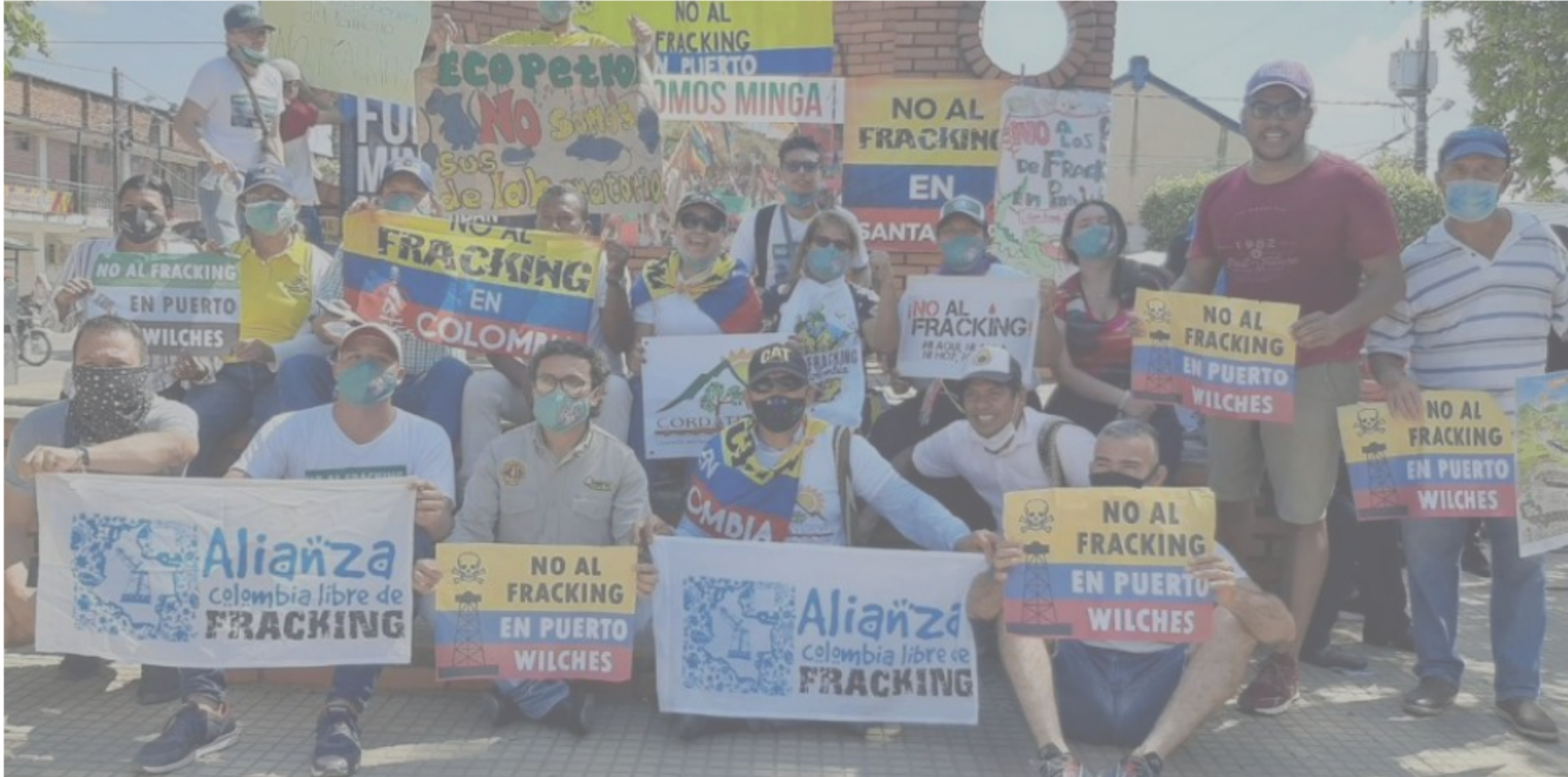
L Agencia Nacional de Hidrocarburos y Ecopetrol firmaron el contrato especial para la ejecución del proyecto piloto de investigación en Puerto Wilches. Ambientalistas se han opuesto a la medida.

RELACIONADOS: AMENAZAS A LÍDERES | FRACKING | PUERTO WILCHES