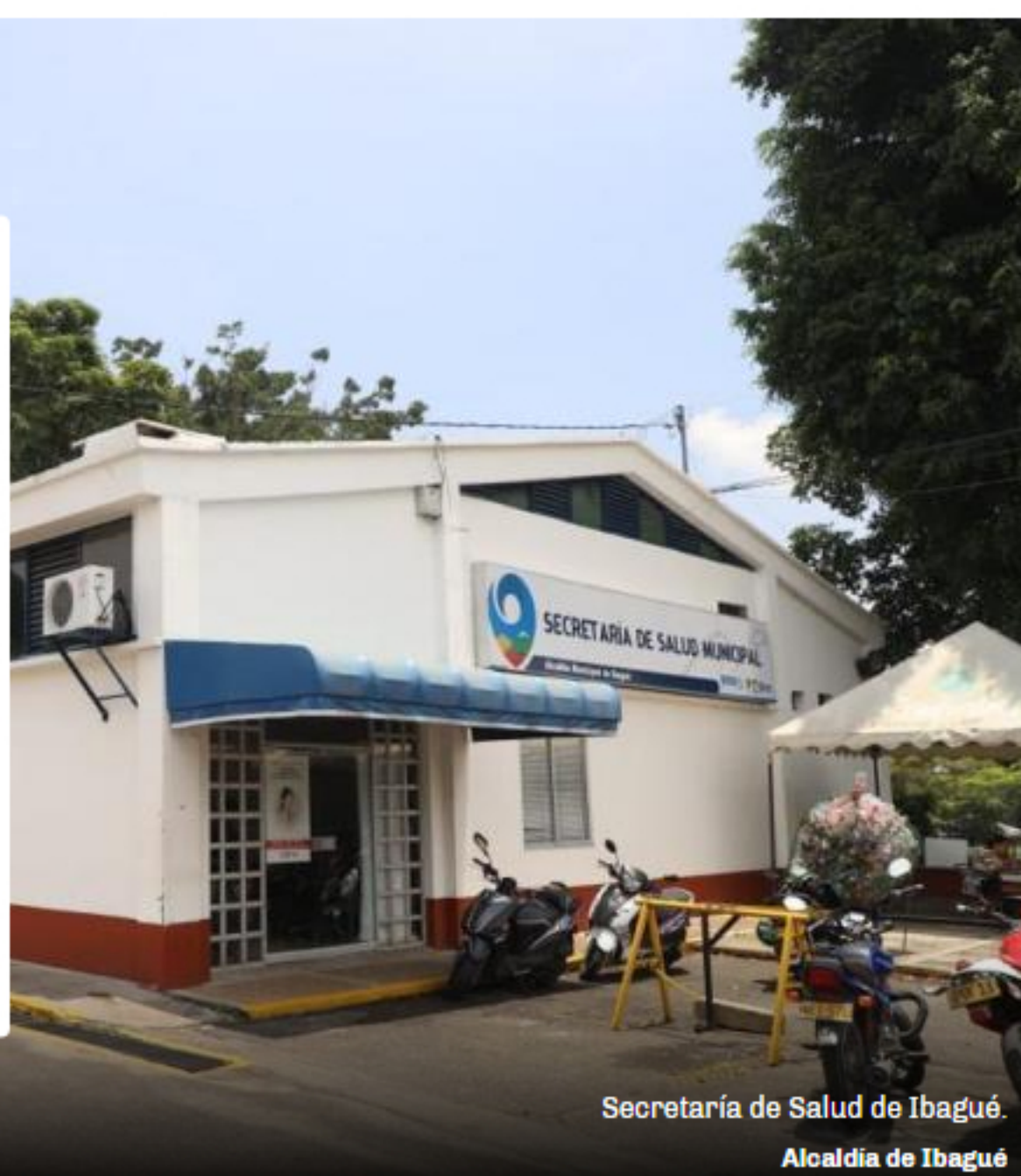
Secretaría de Salud de Ibagué. Alcaldía de Ibagué

En la Personería Municipal de Ibagué se prendieron las alarmas por el aparente sobrecosto en la celebración del contrato de arrendamiento de un inmueble para el funcionamiento de la nueva sede de la Secretaría de Salud local.