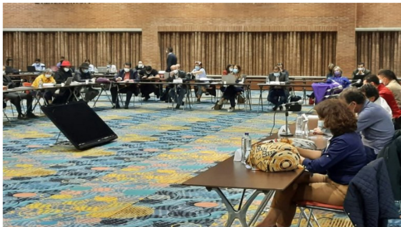
Panorámica de mesa entre Comité Nacional del Paro y Gobierno nacional en reunión del pasado domingo 16 de mayo

Este lunes 17 de mayo se cumplen 20 días ininterrumpidos de Paro Nacional en Colombia.