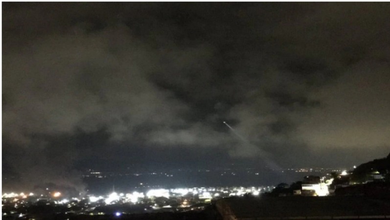
Panorámica de Yumbo en la madrugada del 17 de mayo desde la loma de La Estancia, barrio que fue el epicentro de choque entre manifestantes y Esmad

A través de redes sociales, activistas en conjunto con habitantes del municipio de Yumbo, Valle del Cauca, reportaron enfrentamientos entre manifestantes y Esmad en el barrio popular La Estancia , ubicado en cercanías a la instalación local de Ecopetrol, desde la que se distribuye combustible para el suroccidente del país.