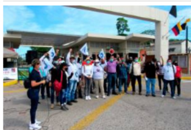
Asamblea permanente en puertas de la refinería

Ante esto, la compañía petrolera rechazó la obstrucción a las vías públicas de acceso, asegurando que "la situación pone en riesgo el abastecimiento normal de combustibles derivados del petróleo , vulnera el derecho al trabajo e impide la libre movilización de los trabajadores y de las familias que residen en las instalaciones de la refinería".