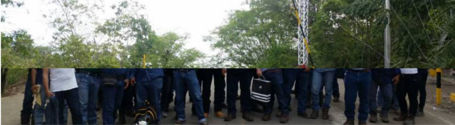
Trabajadores, Puerto Boyacá

Trabajadores de los campos ubicados en Puerto Boyacá denuncian que al menos 250 puestos de trabajo desaparecerán.