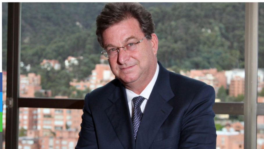
Jaime Gilinski - Forbes