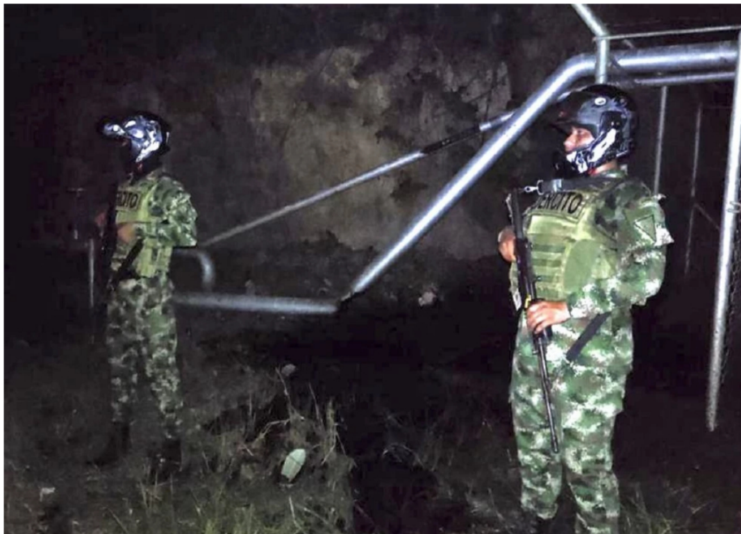
BLU Radio. Atentado contra oleoducto

Presuntos guerrilleros del ELN habrían cometido los ataques con explosivos a la infraestructura de Ecopetrol .