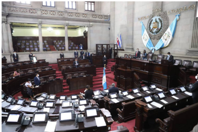
Congreso de la República Guatemala otorgará subsidio por dos meses al diésel y gasolina por alza en precios.

El centro del continente no ha sido ajeno a ninguna de estas medidas: Guatemala aprobó esta semana un subsidio para evitar que el precio de la gasolina siga presionando la inflación. El Congreso de ese país avaló la propuesta del Gobierno de subvencionar el galón de diésel y el de la gasolina regular, por lo que se deberá ampliar el Presupuesto General presentado para este año.