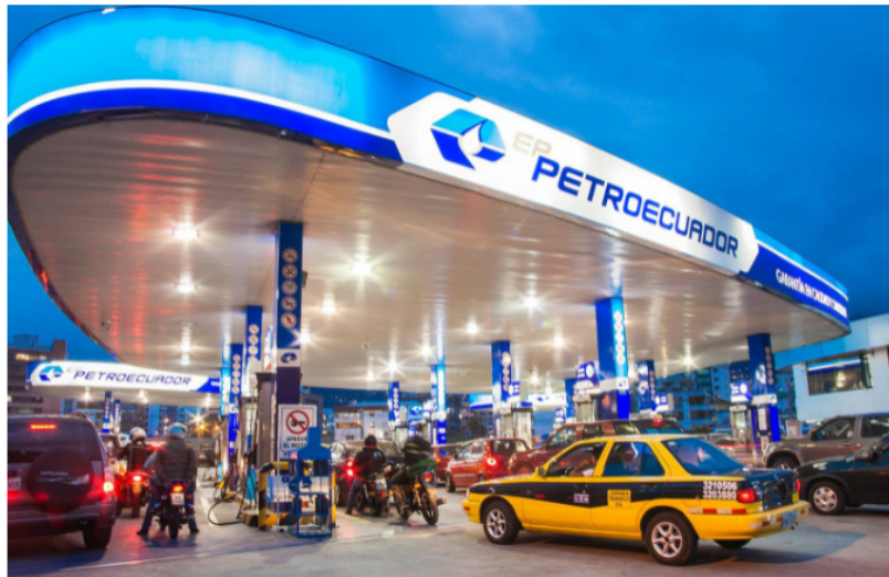
Precio de la gasolina en Ecuador La gasolina súper o Premium cuesta US$3,68 por galón actualmente.

Ecuador no ha sido ajeno a estas decisiones y para este mes la gasolina Súper o Premium se venderá en US$3,98 por galón o incluso más, pues las empresas privadas tienen libertad para de terminar un valor más alto. Este incremento es un US$0,30 mayor al del mes pasado, cuando se ubicó en US$3,68, lo que representa un aumento de un 8%.