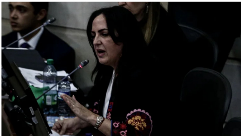
La senadora volvió a referirse a la reforma tributaria del gobierno Petro.

La senadora del Centro Democrático, María Fernanda Cabal , ha dejado en claro su posición con respecto a la reforma tributaria del gobierno de Gustavo Petro, la cual fue gestada por el ministro de Hacienda José Antonio Ocampo. La parlamentaria ha manifestado en varias ocasiones su rechazo a esta forma de recaudo y ha advertido sobre las consecuencias negativas de este.