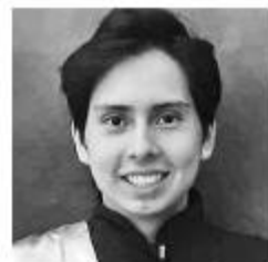
JOAQUÍN LÓPEZ Enviado especial*

Cada vez está más cerca que una persona en Bogotá pueda negociar con la BVC una acción de Falabella , o alguien en Santiago, una de Ecopetrol . Precisamente ese es el objetivo de la integración de los mercados de