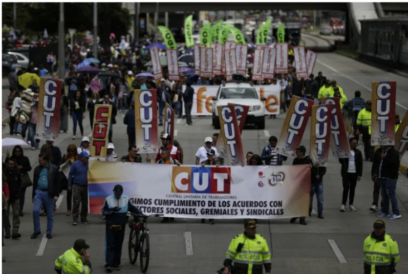
Marcha de centrales obreras en 2019

Fue histórico para la Central Unitaria de Trabajadores (CUT) apoyar, por primera vez, un gobierno al llegar Gustavo Petro a la Presidencia de la República. Sin embargo, la cercanía con el mandatario no ha convencido a todos los miembros de una de las agremiaciones sindicales más grandes del país, que se encuentra dividida por el apoyo a la reforma tributaria.