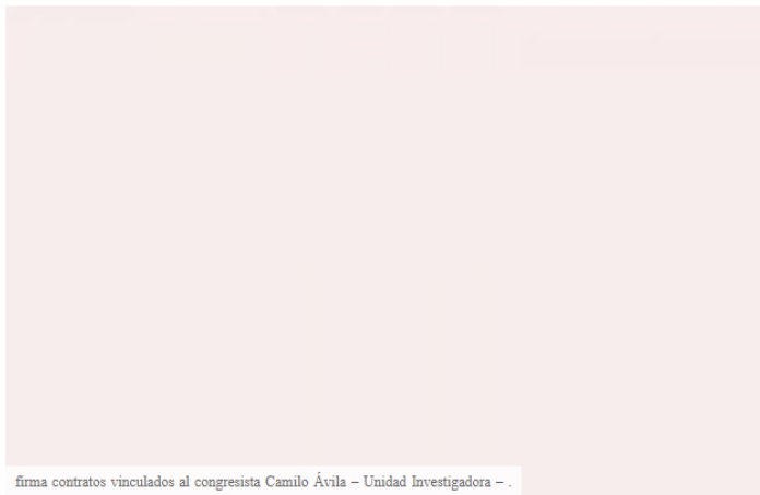
firma contratos vinculados al congresista Camilo Ávila - Unidad Investigadora -