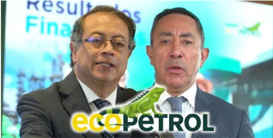
Ecopetrol reportó su utilidad neta para el segundo trimestre de 2023

Ecopetrol , que es una fuente crucial para las finanzas del Estado, ha reportada una dramática caída en su utilidad neta. ¿Por qué la disminución?