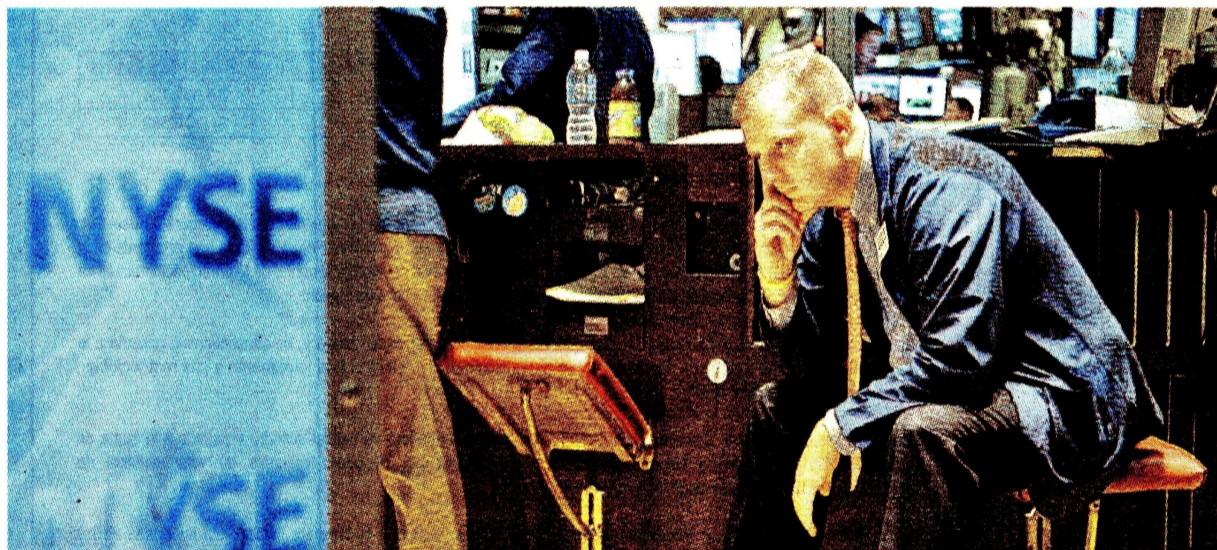
Con la quiebra de Lehman Brothers, Wall Street se desplomó y la crisis bancaria se extendió a otros mercados.