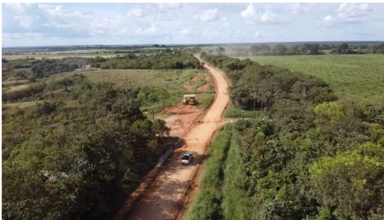
Vía Neblinas-Rubiales, en Puerto Gaitán

Con la firma del acta de inicio y la socialización ante la comunidad de las veredas de la zona de influencia, la próxima semana comenzará la ejecución del contrato por medio del cual la Alcaldía de Puerto Gaitán hará realidad la pavimentación de los primeros kilómetros de la vía entre el Alto Neblinas y el campo Rubiales .