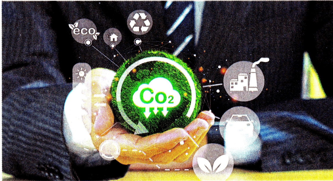
La certificación 'Carbono Neutro' asegura que las empresas, países y personas son capaces de mantener un balance cero entre sus emisiones de gases de efecto invernadero (GEI) y sus absorciones.

"Lo que han alcanzado ISA y sus empresas da cuenta de un compromiso tangible con la mitigación del