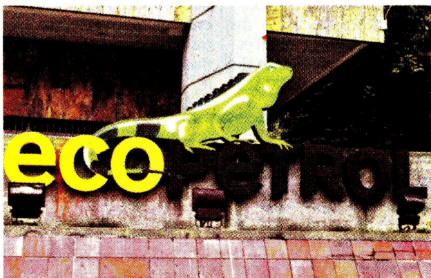
Desde agosto del año pasado han salido 7 directivos. El Tiempo