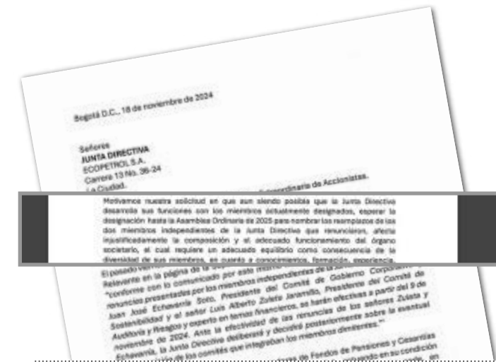
Los fondos de pensiones piden asamblea extraordinaria en Ecopetrol tras salidas de miembros de junta.