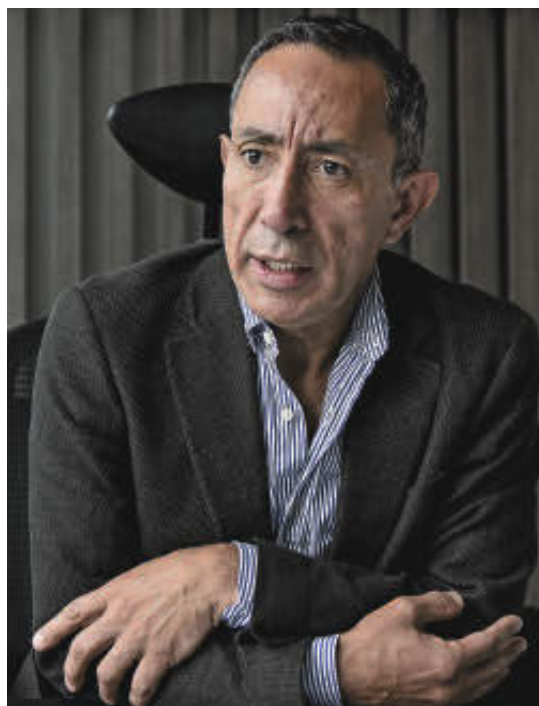
RICARDO ROA Presidente de Ecopetrol