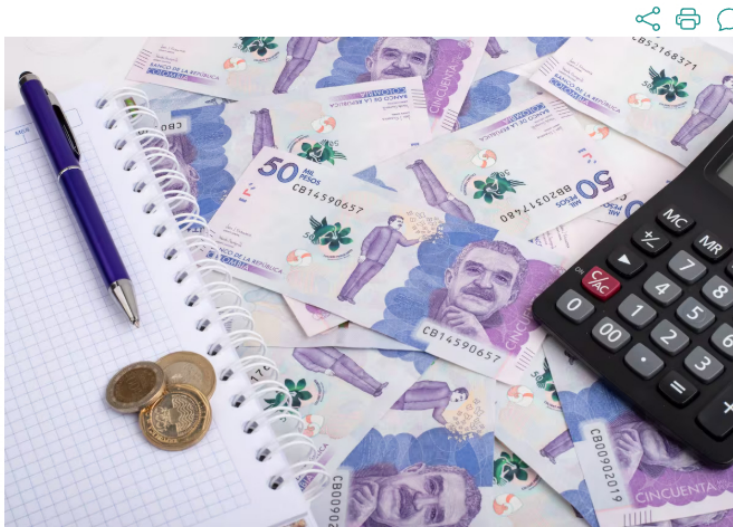
De acuerdo con el grupo de investigaciones económicas del Banco de Bogotá, el Gobierno está al límite en el cumplimiento de la Regla Fiscal durante el primer semestre del año.

La caja del Gobierno Nacional no pasa por su mejor momento. A pesar de las maniobras del Gobierno, los gastos crecen a un ritmo mayor que los ingresos.