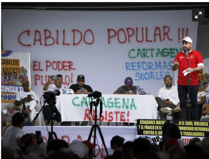
Ministro de Minas y Energía, Edwin Palma, descarta posible llegada a la presidencia de Ecopetrol

El jefe de la cartera estuvo en Cabildo Abierto en Cartagena y en el Séptimo foro de XM 'Desafíos del entorno para un sector cada vez más complejo'