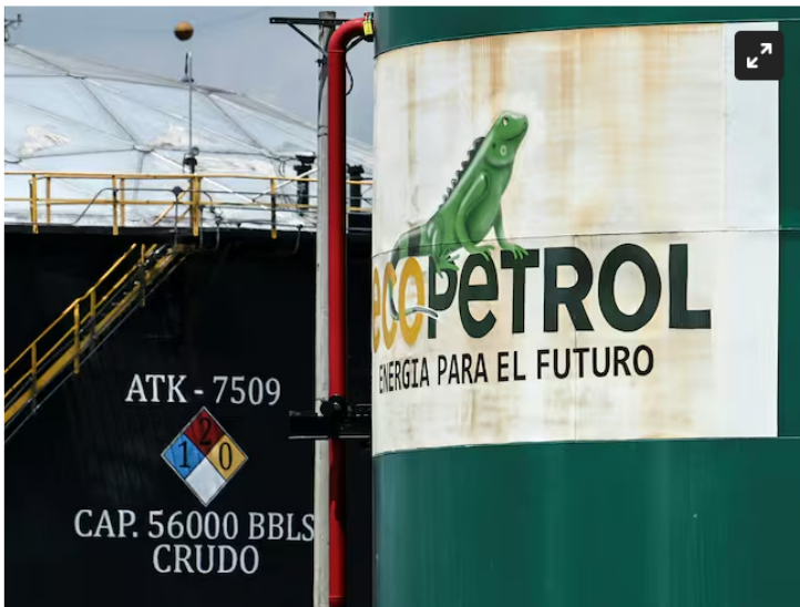
The logo of Colombian petroleum company Ecopetrol is seen on a crude oil storage tank at the plant in Acacias, Meta Department, south of Bogota on February 10, 2023.