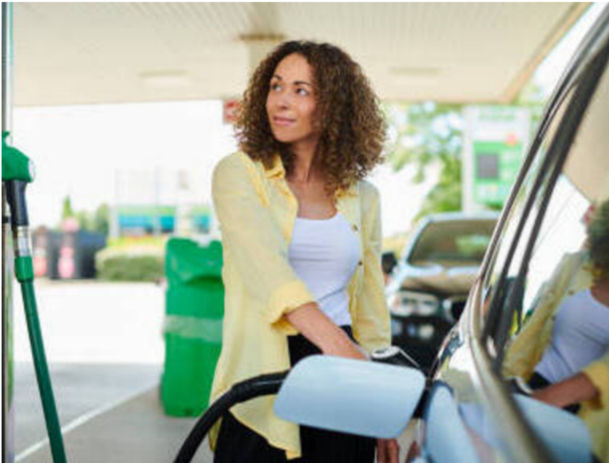
Algunas ciudades se vieron afectadas por el aumento del precio de la gasolina el 1 de enero.

La empresa destacó que este pacto refleja el reconocimiento pleno de la obligación por parte del Gobierno y un trabajo conjunto para reducir los saldos pendientes del FEPC.