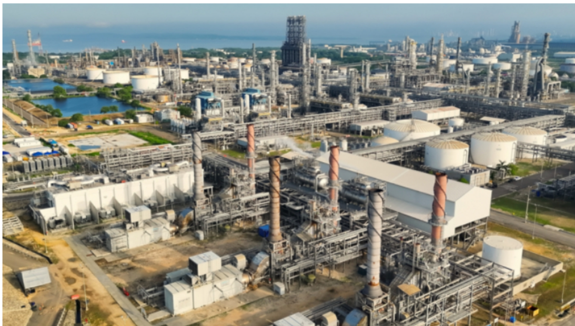
Refinería de Cartagena (Reficar)

Petrolera estatal cerró un acuerdo con la Nación para el pago de una deuda del FEPC y obtuvo luz verde para un crédito externo por USD 1.250 millones.